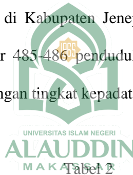
Tabel 2 Tabel Kepadatan Penduduk menurut Kecamatan dan Jenis Kelamin di Kabupaten Jeneponto Tahun 2019

Kepadatan penduduk di Kabupaten Jeneponto yaitu 485,19. Hal ini berarti setiap 1 km 2 terdapat sekitar 485-486 penduduk. Wilayah paling padat penduduk adalah kecamatan binamu dengan tingkat kepadatan penduduk sebesar 820,58.