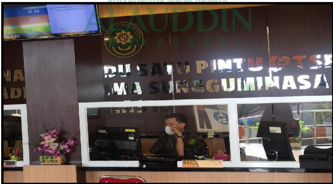
Pelayanan Terpadu Satu Pintu (PTSP) Pengadilan Agama Sungguminasa Kelas IB