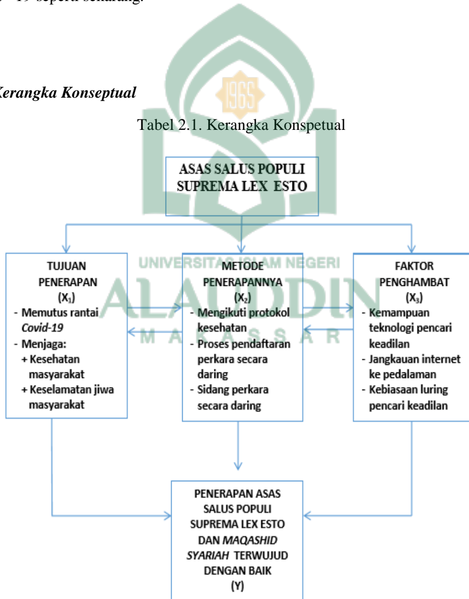
Tabel 2.1. Kerangka Konseptual