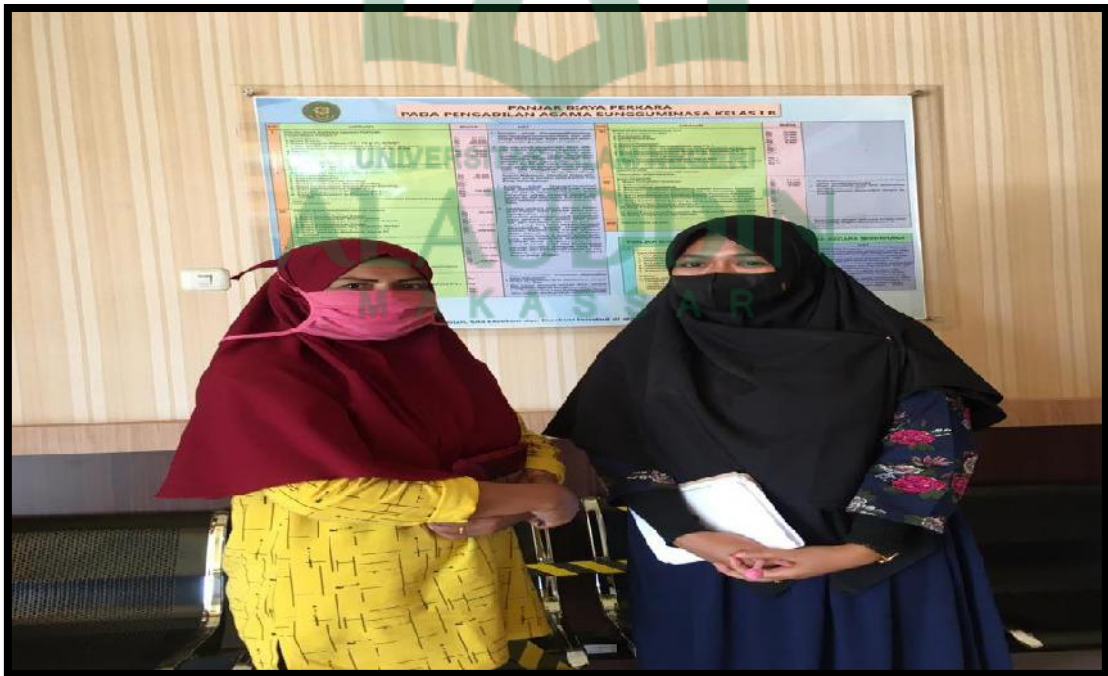
Dokumentasi Wawancara Masyarakat Pencari Keadilan di Pengadilan Agama Sungguminasa Kelas I B

SARANA DAN PRASARANA DI PENGADILAN AGAMA SUNGGUMINASA KELAS I B DI MASA PANDEMI COVID-19.