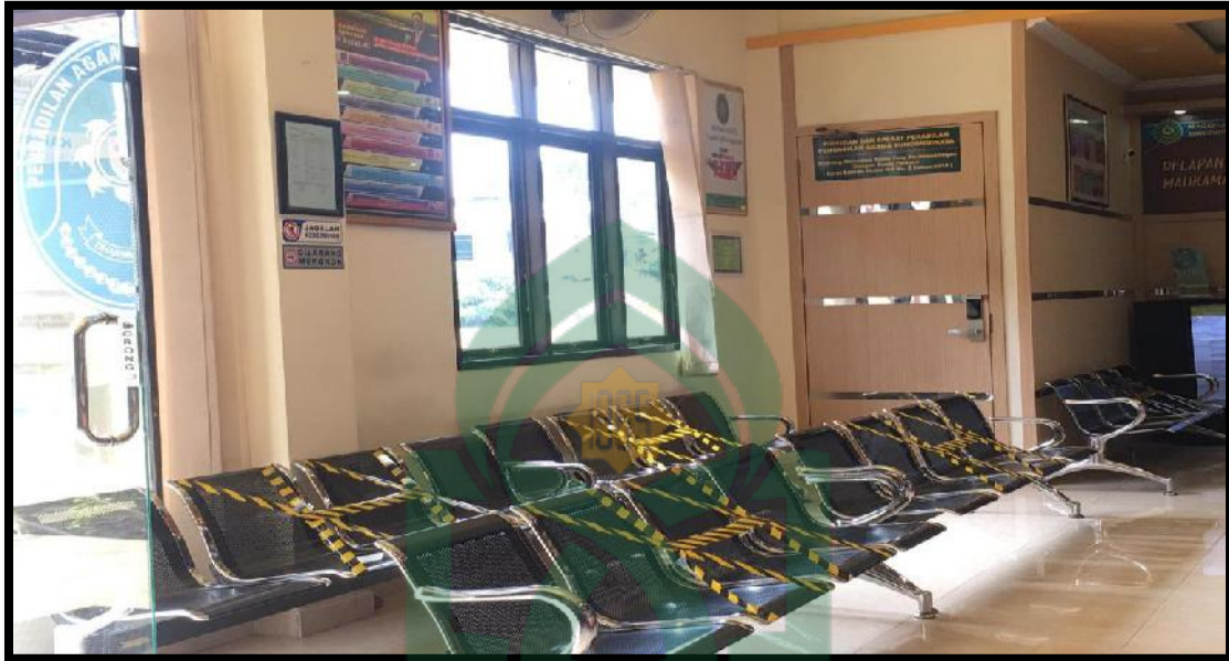
Kursi di ruang tunggu persidangan