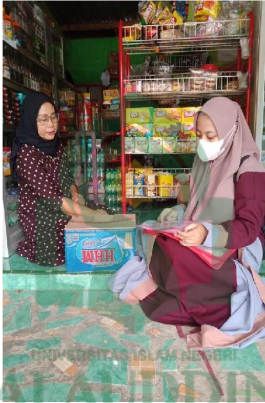
Gambar 8. Kardus Air HHM