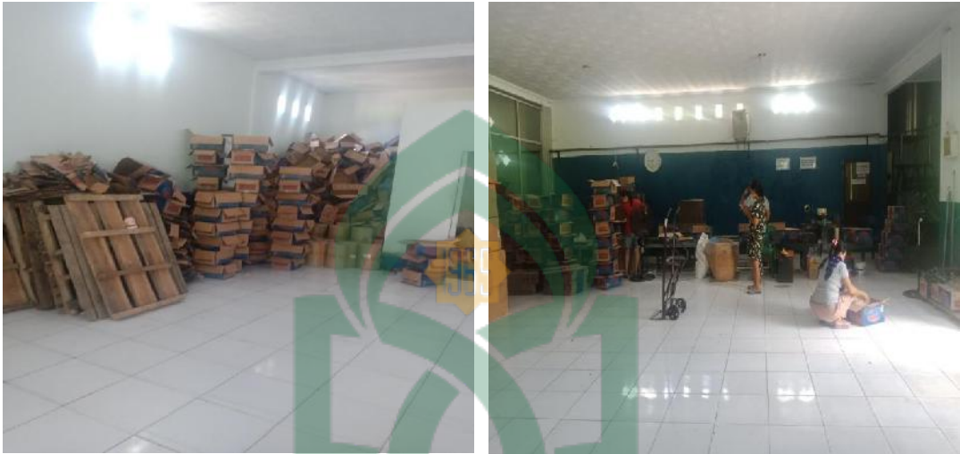
Gambar 2. Proses packing Air HHM