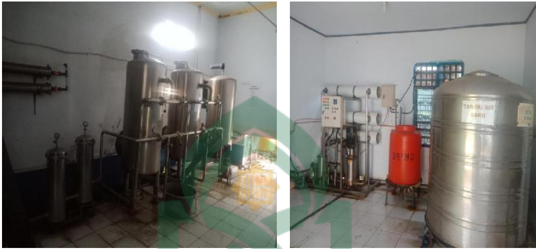
Gambar 4. Alat Produksi