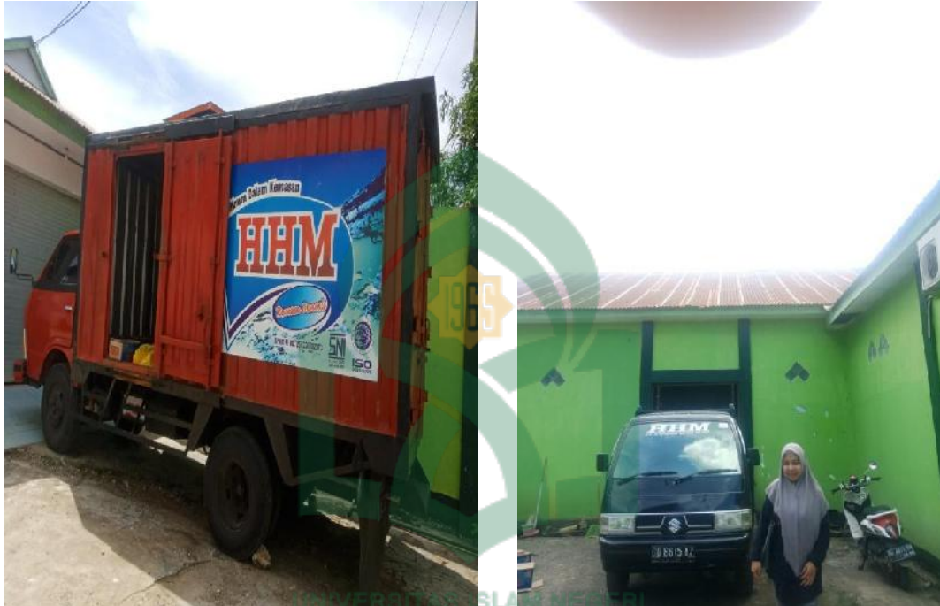
Gambar 6. Wawancara dengan karyawan CV. Karunia Alam Abadi.