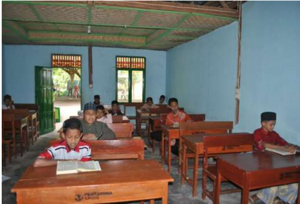
pelatihan guru mengaji sekabupaten pinrang