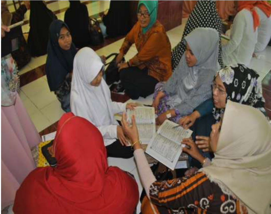
Acara maulid dan wisuda santri