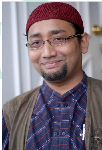
Gambar 1.1 Foto Habiburrahman El Shyrazi

Habiburrahman merupakan seorang pembicara dalam forum-forum nasional dan internasional. Beragam karyanya laris misalnya novel Ayat-ayat Cinta tahun 2004, Pudarnya Pesona Cleopatra tahun 2004, Di Atas Sajadah Cinta tahun 2004, Ketika Cinta Berbuah Surga tahun 2005, Ketika Cinta Bertasbih tahun 2007.