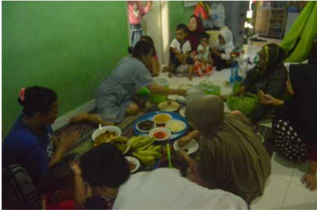
Foto 1.9 Acara makan bersama