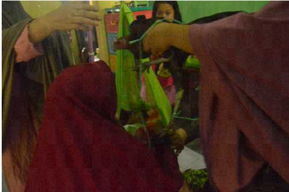
Foto 1.7 Prosesi massembai' manu'