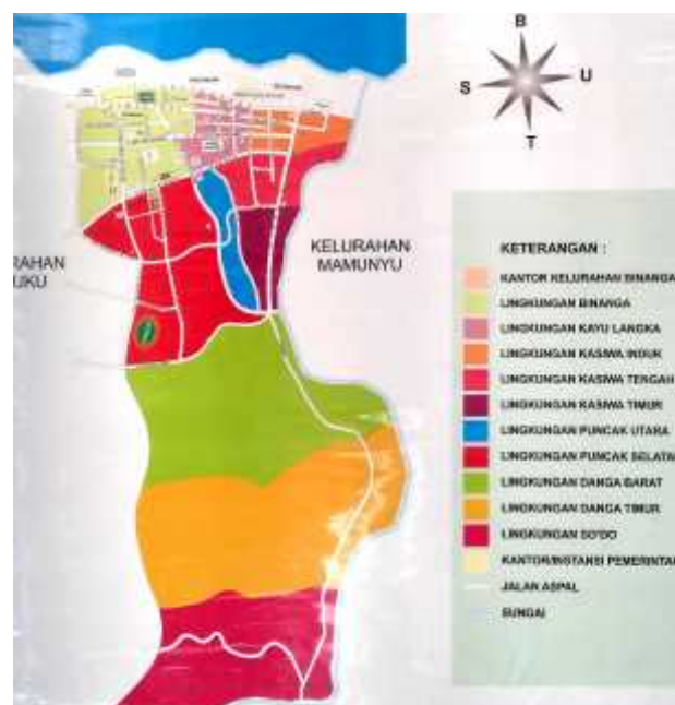
Gambar 4.1 Peta Kelurahan Binanga

Kelurahan Binanga merupakan salah satu kelurahan di wilayah kecamatan Mamuju yang terletak di pusat kota Mamuju provinsi Sulawesi barat. Kelurahan ini terbagi menjadi 11 wilayah lingkungan yaitu: Binanga, Kayu Langka, Kasiwa Induk, Kasiwa Tengah, Kasiwa Timur, Puncak Utara, Puncak Selatan, Danga, Parung-parung, dan So'do. Kelurahan ini secara geografis terletak di posisi 2 40'28.3" lintang selatan 118 53'30.5" bujur timur, dengan luas wilayah secara keseluruhan adalah 34,04 Km 2 dan persentase dari luas kecamatan 16,47%.