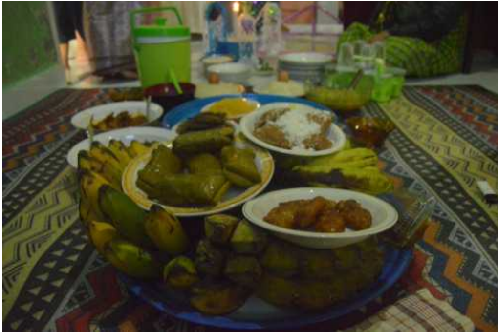
Foto 1.1 Perlengkapan tradisi mappadai' toyang