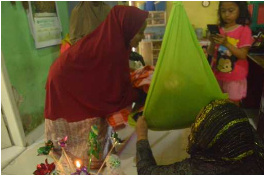
Foto 1.6 Menaikkan anak ke ayunan