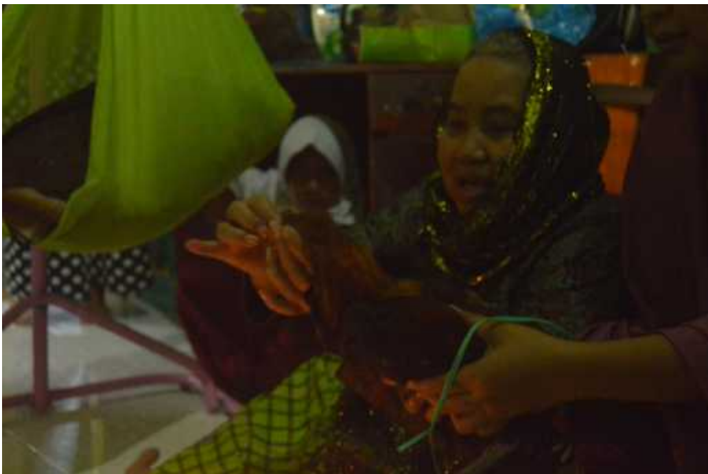
Foto 1.4 Prosesi maccera