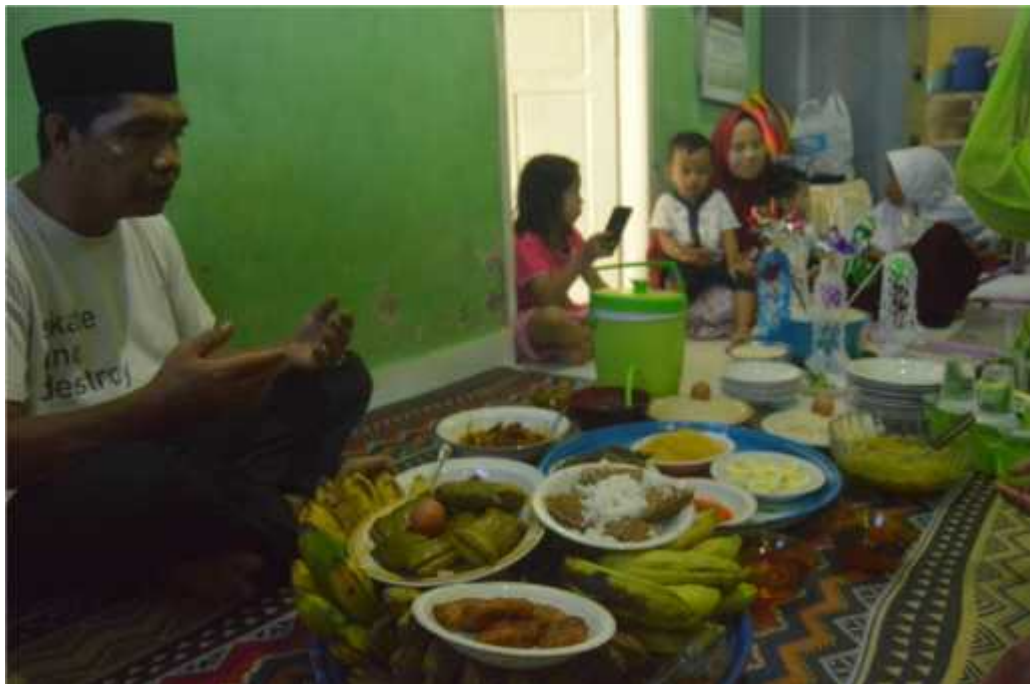
Foto 1.8 Doa bersama