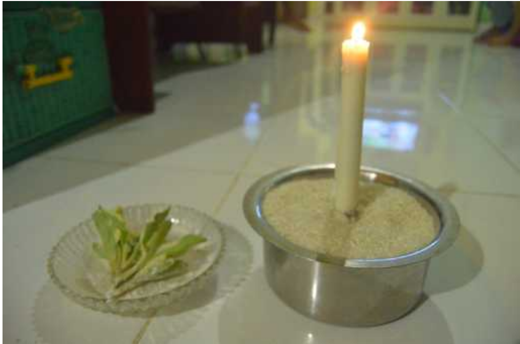
Foto 1.3 Alat yang digunakan untuk macco'bo