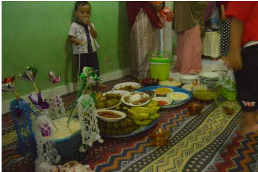
Foto 1.2 Perlengkapan tradisi mappadai' toyang