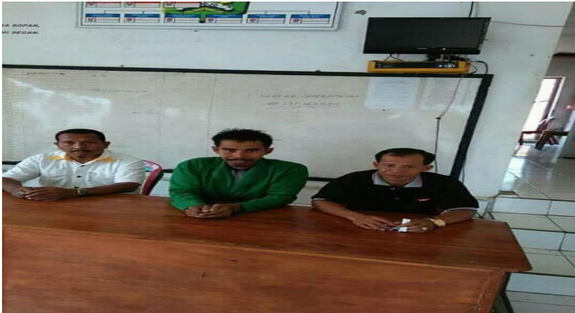
Selesai wawancara dengan kades dan stanya Bundahara