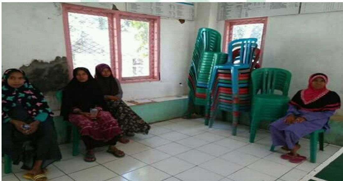
Ibu-ibu bersosialisasi di kantor desa tentang perkelahan remaja yang melibatkan anak-anaknya.