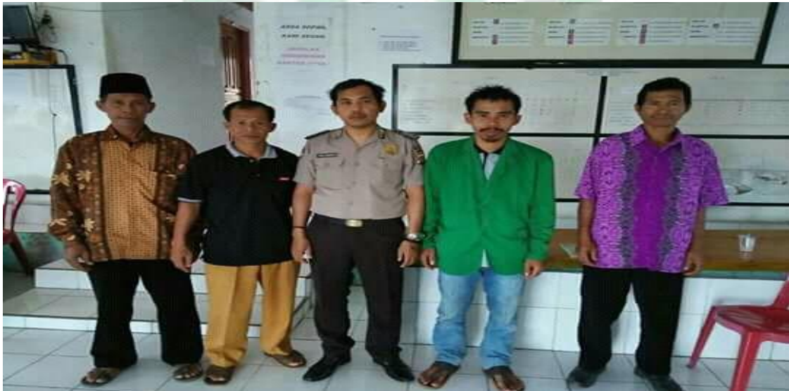
Foto bersama kepala desa Doridungga dan kapolres kecamatan Donggo