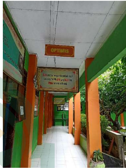
Suasana Depan Ruang Kelas