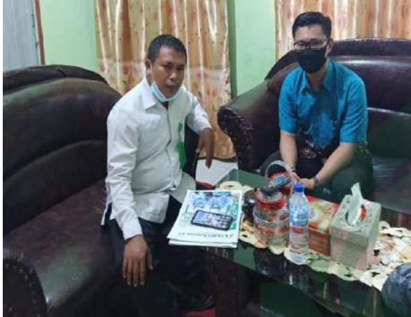
Foto dengan Kepsek MAN Kepulauan Selayar