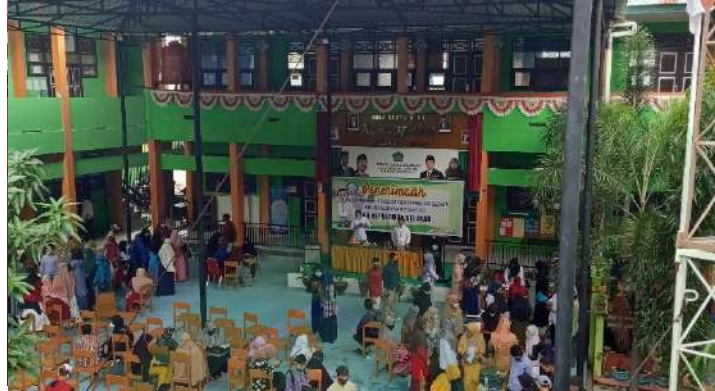
Gambar 4.3 Kegiatan ekstrakurikuler MAN Kepulauan Selayar

“Berbicara faktor pendukung keberhasilan, salah satu yang mungkin dikatakan dapat mendukung strategi kepala madrasah dalam meningkatkan mutu pendidikan madrasah yaitu tersedianya ekstrakurikuler sebagai wadah minat dan bakat peserta didik di MAN Kepulauan Selayar” 57