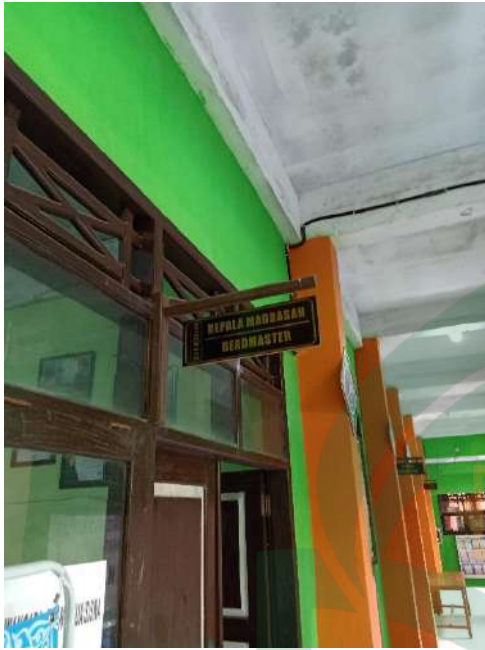
Ruangan Kepala madrasah