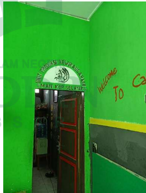
Unit Produksi Kewirausahaan