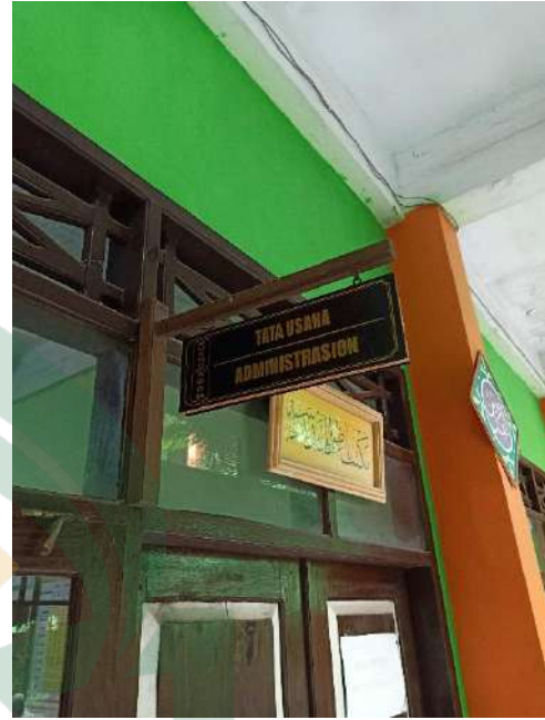
Ruangan Tata Usaha