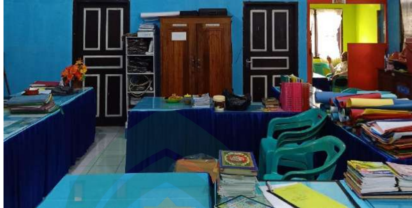
Gambar 4.2 Sarana dan Prasarana Ruang Guru

“Selama saya bertugas disini, saya merasa sangat bersyukur dan termotivasi karna kepala sekolah kami selalu mengutamakan bagaimana sarana dan prasarannya kegiatan siswa maupun guru diusahakan bagaimana supaya segala kegiatan berjalan lancar dengan adanya sarana prasarana yang memadai dan sesuai yang diharapkan” 56