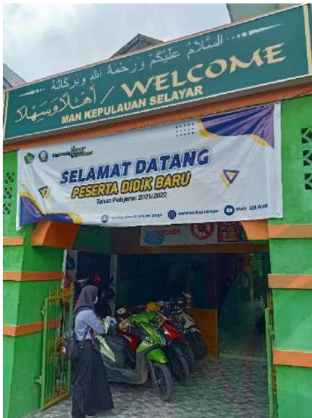
Gerbang Depan MAN