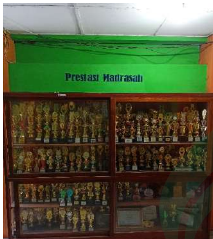
Prestasi MAN Kepulauan Selayar