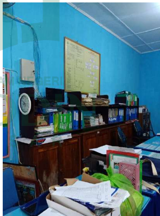
Ruang Guru dan Arsip