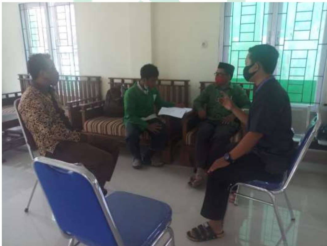
Wawancara dengan Pak Imam dan Para Penyuluh Non PNS di KUA Kecamatan Bontonompo.