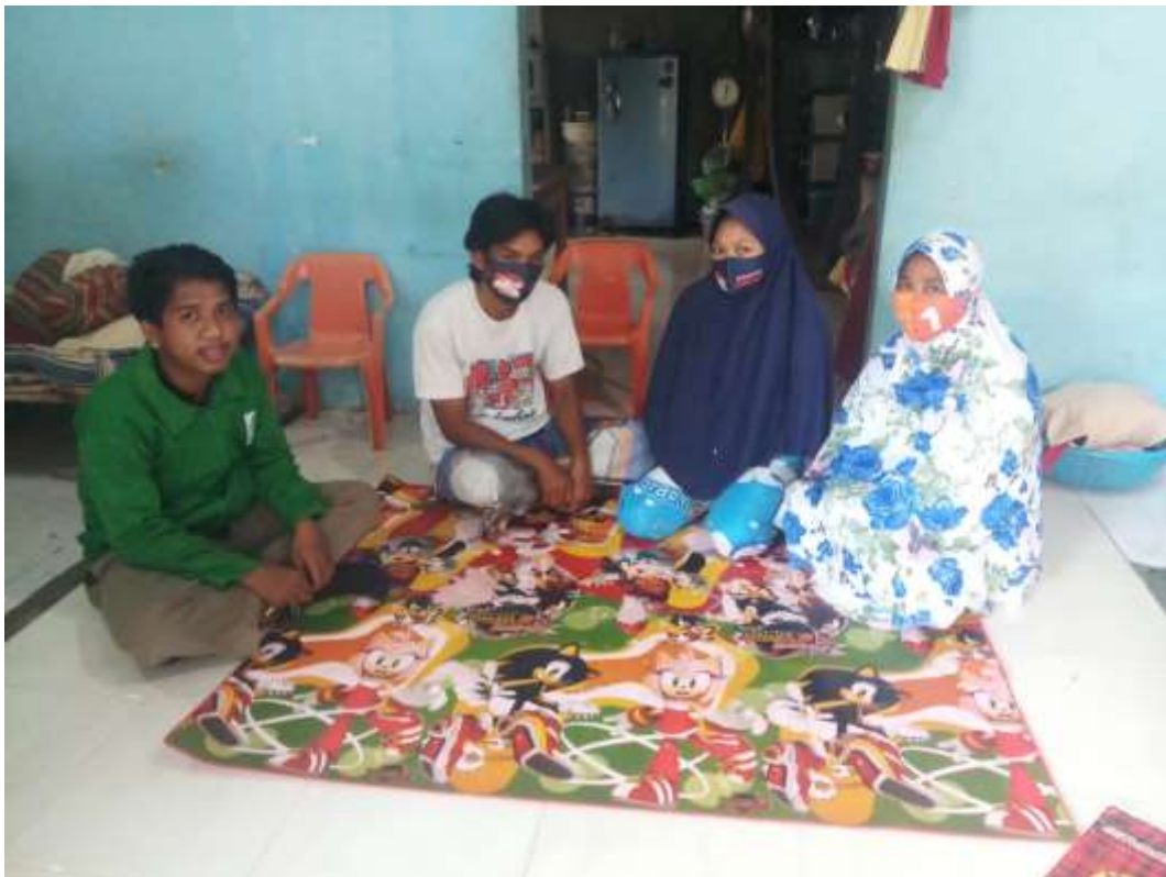
Wawancara dengan Ibu dan Ayah Pelaku pernikahan dini