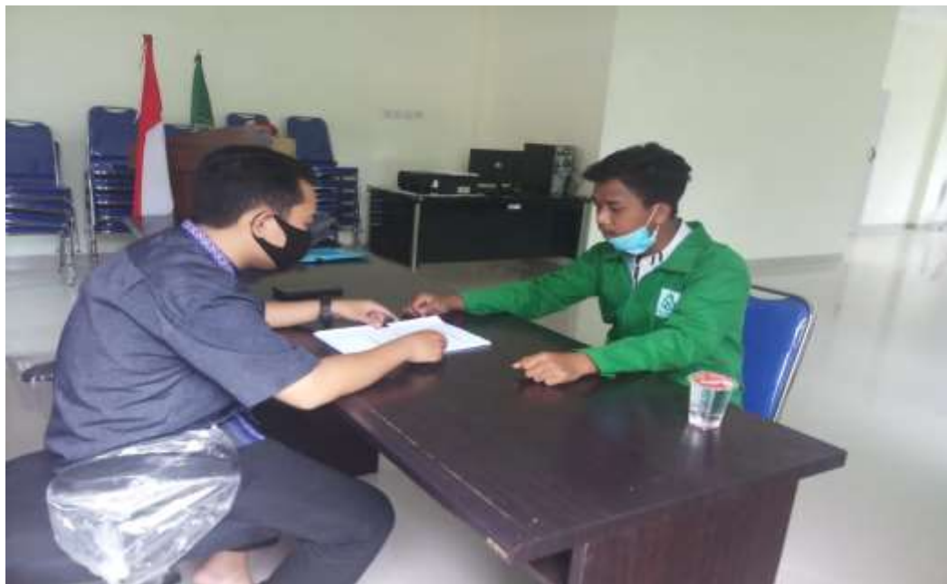
Wawancara dengan salah satu Penyuluh Non-PNS KUA Kecamatan Bontonompo