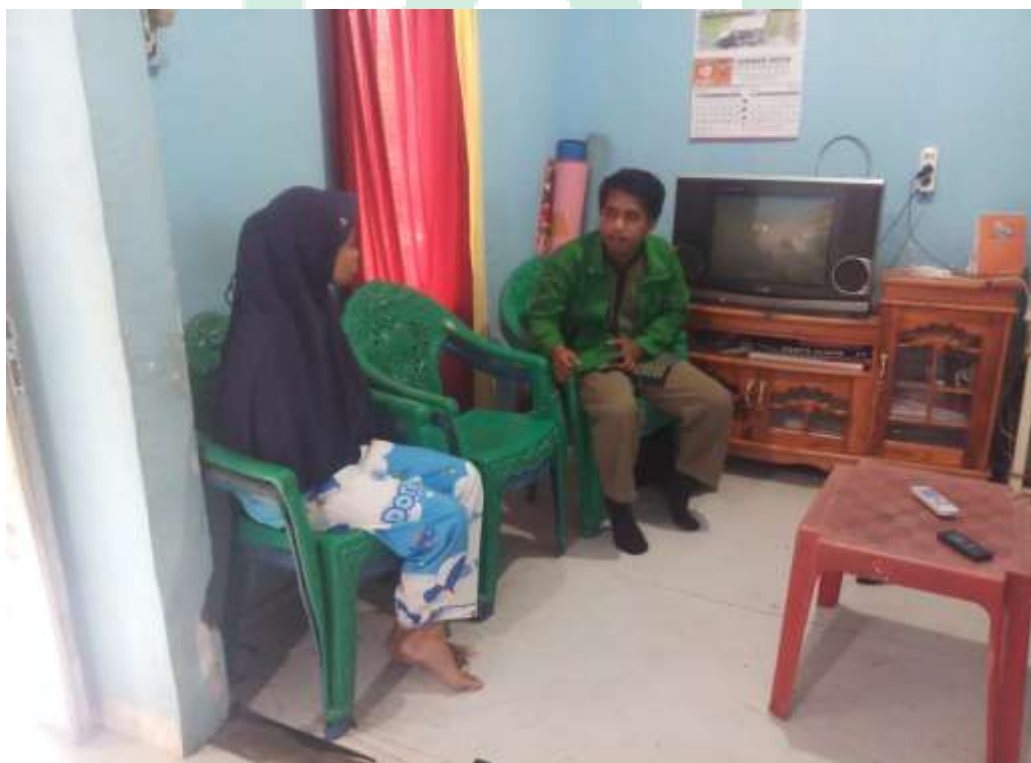
Wawancara dengan pelaku pernikahan dini di Kelurahan Tamallayang