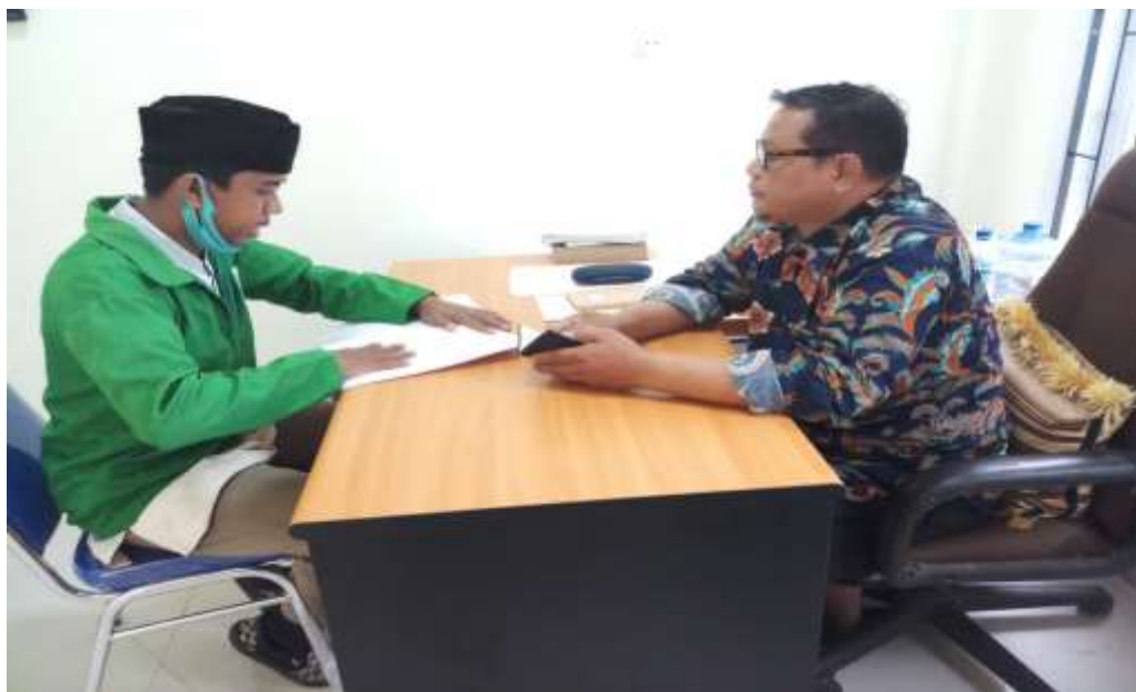
Wawancara dengan Penyuluh Agama PNS KUA Bontonompo