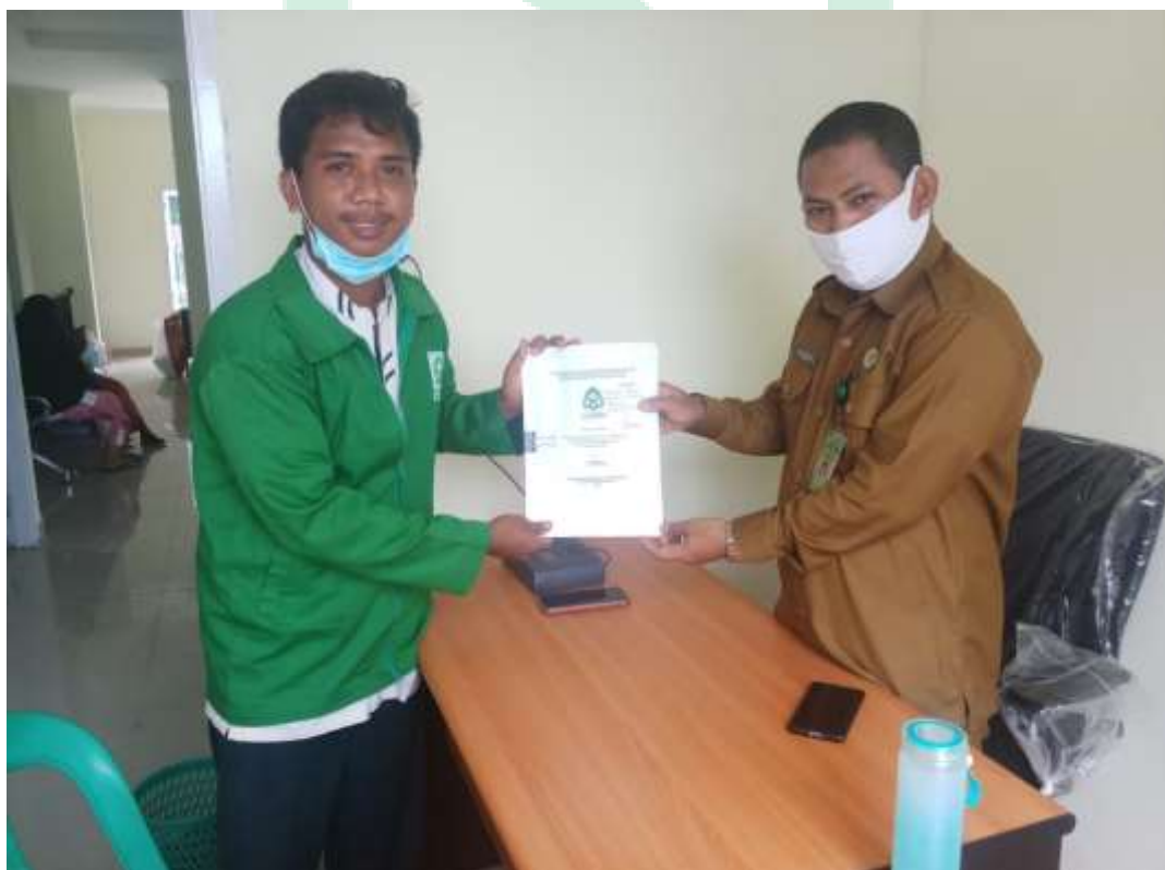
Wawancara dengan Kepala Kantor Urusan Agama Kecamatan Bontonompo