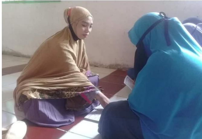
Gambar 5. Proses Pembelajaran Alquran