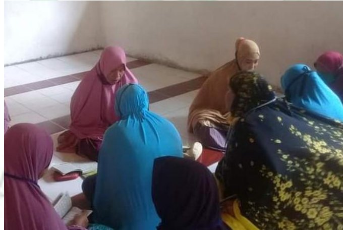
Gambar 6. Proses pembelajaran Alquran