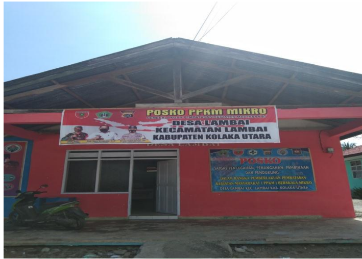
Gambar 1. Lokasi Kantor Desa Lambai