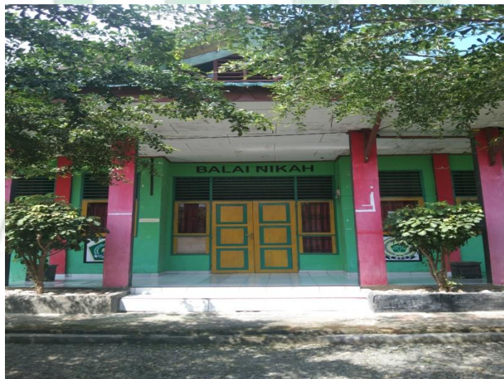
Gambar 2. Lokasi Kantor Urusan Agama Kecamatan Lambai