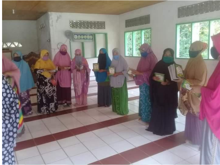
Gambar 3. Proses Pembelajaran Alquran