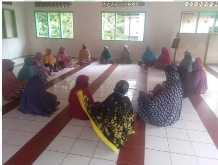
Gambar 4. Proses Pembelajaran Alquran