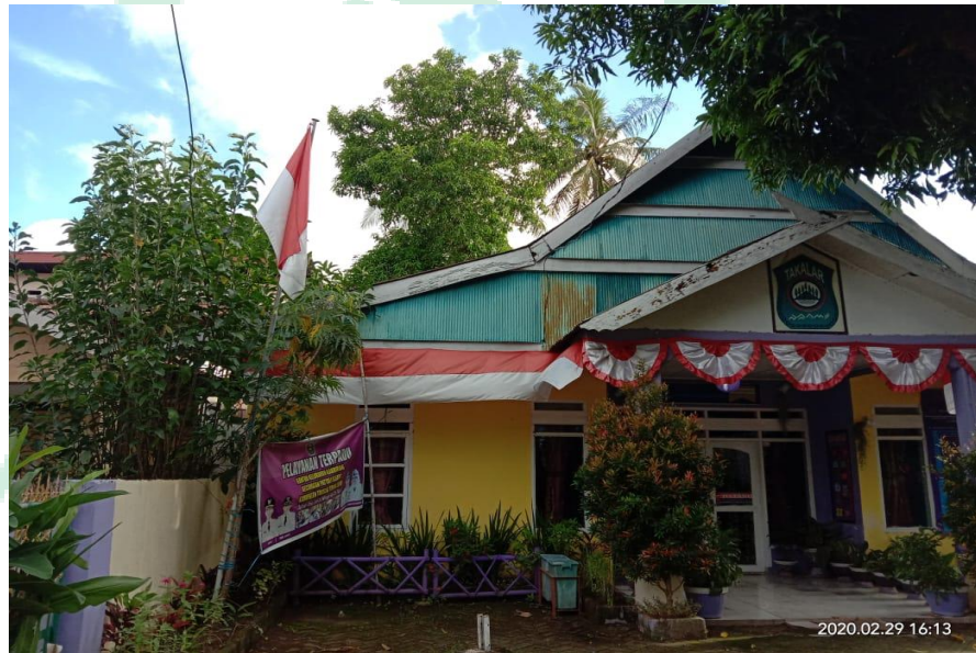
Kantor Kelurahan Kalabbirang, pada tanggal 29 Ferbruari 2020