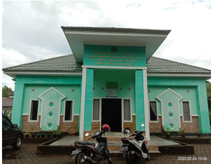
Kantor KUA Kecamatan Pattallassang Kabupaten Takalar Tahun 2020