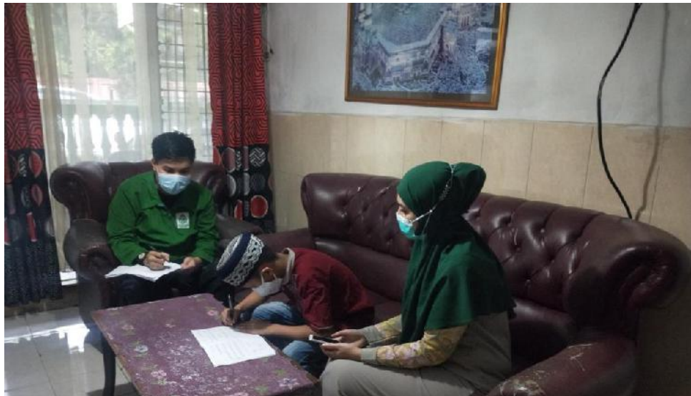
OBSERVASI DENGAN ORANG TUA PESERTA DIDIK