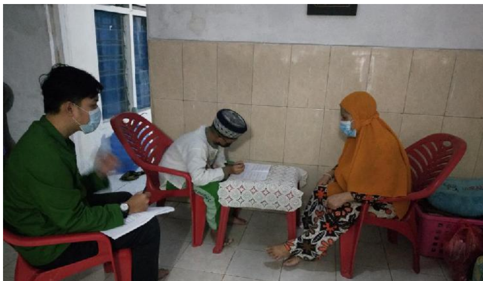
OBSERVASI PROSES PEMBELAJARAN DARING