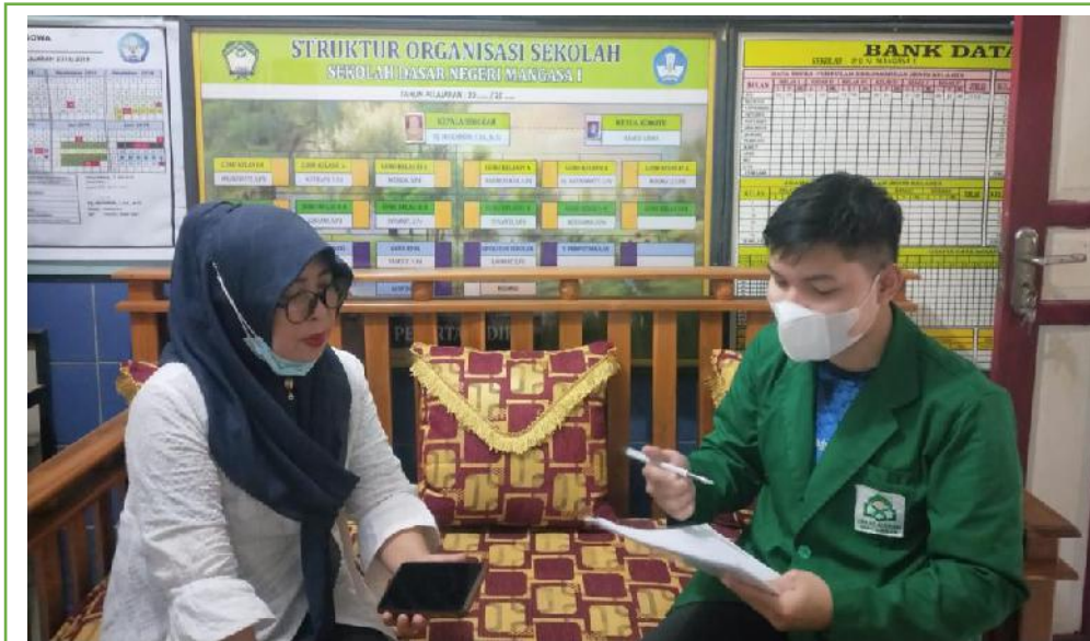
PERTEMUAN DENGAN KEPALA SEKOLAH