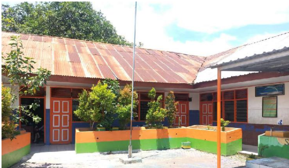
LAPANGAN SD NEGERI MANGASA 1