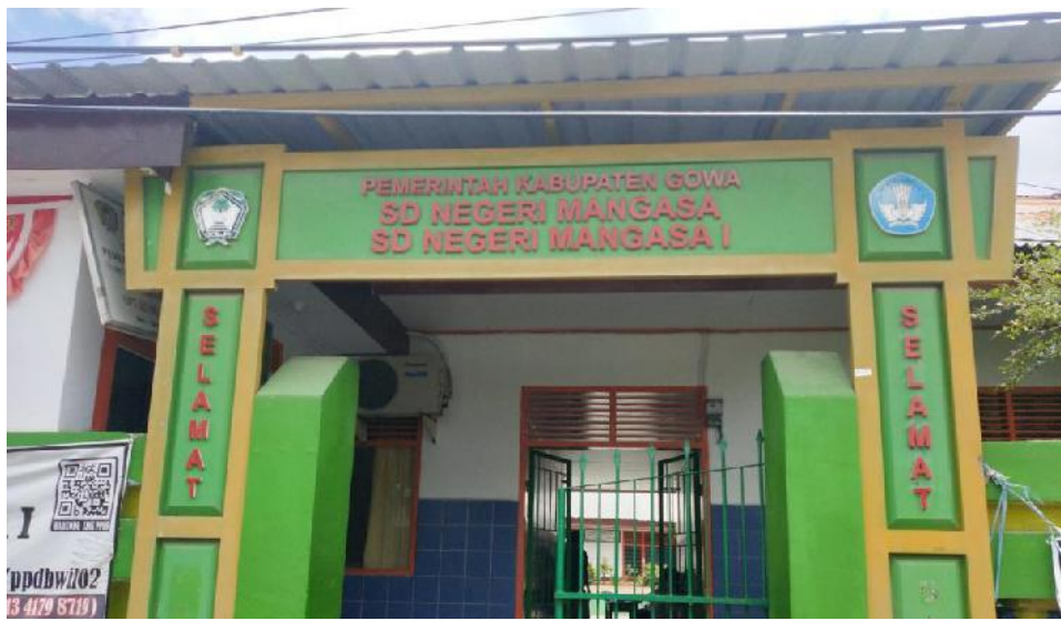
SD NEGERI MANGASA 1 KABUPATEN GOWA