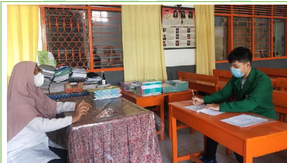
OBSERVASI DENGAN GURU PAI