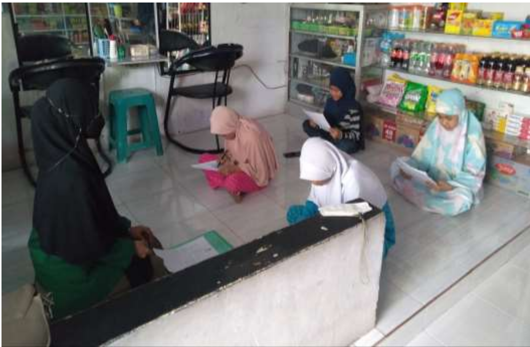
Pengisian lembar angket oleh peserta didik

UNIVERSITAS ISLAM NEGERI ALAUDDIN M A K A S S A R