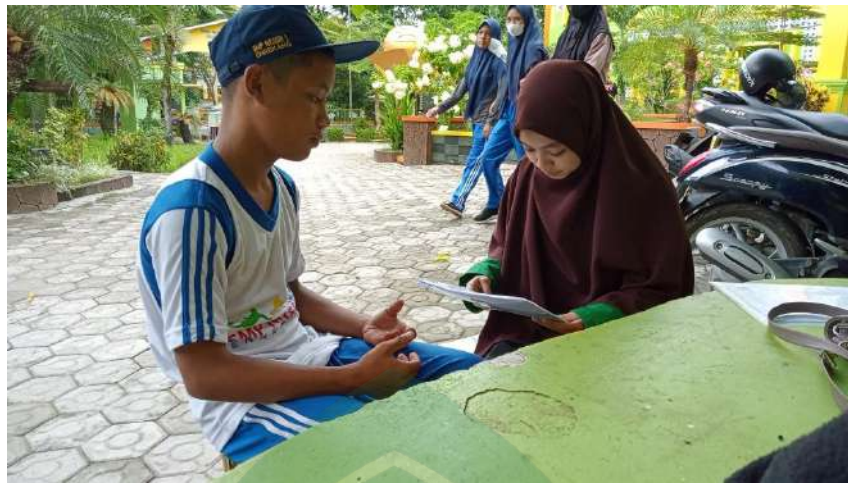
Wawancara dengan peserta didik