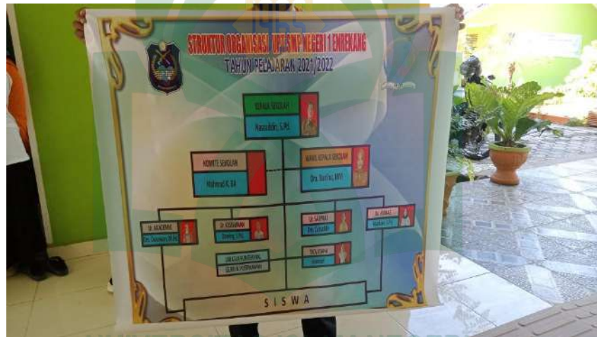
Spanduk struktur organisasi SMP Negeri 1 Enrekang