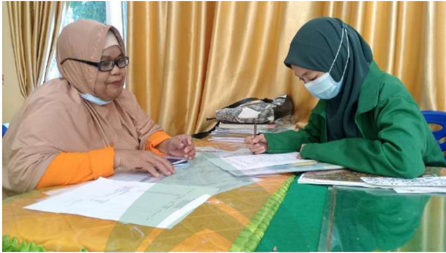
Wawancara dengan guru Pendidikan agama Islam kelas VIII