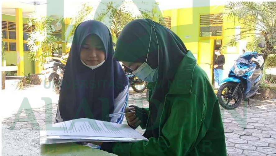
Wawancara dengan peserta didik kelas VIII