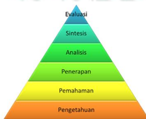
6 Aspek dalam Ranah Kognitif

Ranah kognitif yang menekankan pada aspek intelektual, seperti pengetahuan, pengertian, dan keterampilan berpikir. Benjamin S. Bloom seorang ahli psikologi membagi ranah kognitif ke dalam enam tingkatan atau kategori, yaitu: