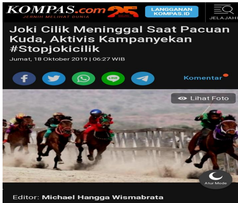
Gambar 1.1 Tampilan Halaman Berita di Situs Berita Kompas.com

menunggangi kuda. Joki cilik harus merelakan waktu menempuh pendidikan tidak kurang dari sembilanpuluh hari untuk menjalani latihan demi meraih peringkat terbaik pada saat perlombaan digelar.