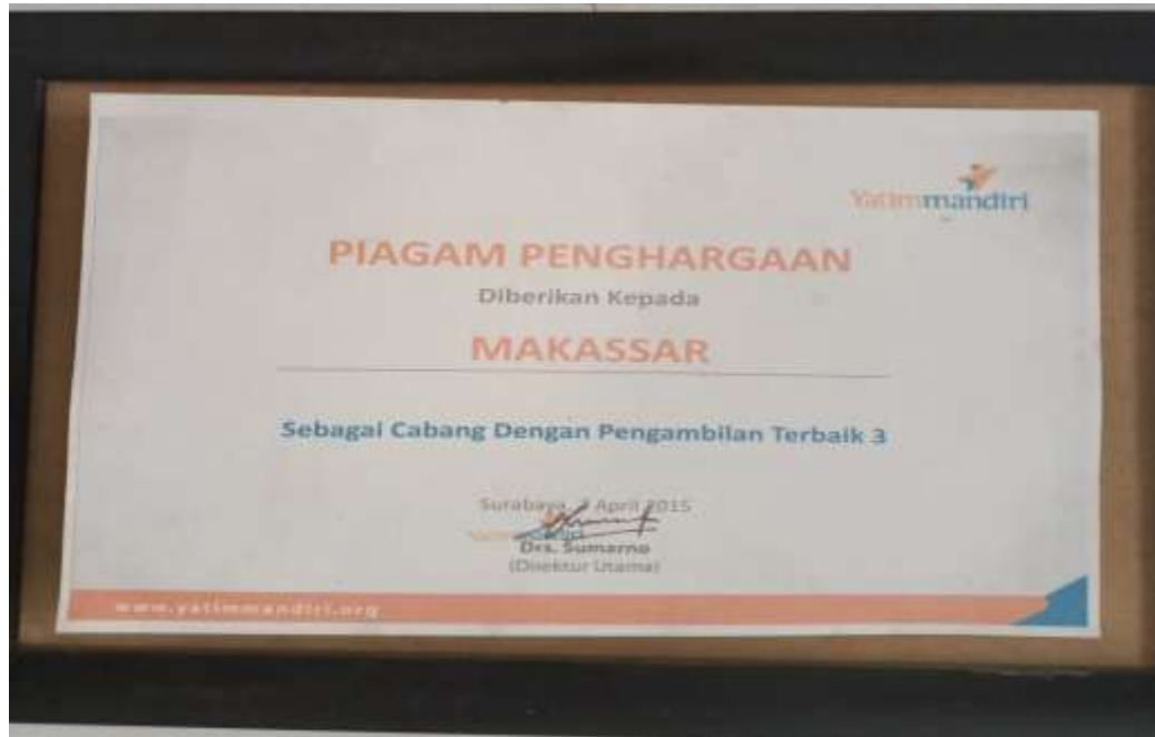
Gambar 5 Piagam Penghargaan Untuk Yatim Mandiri Makassar Sebagai Cabang Pengambilan Terbaik tiga