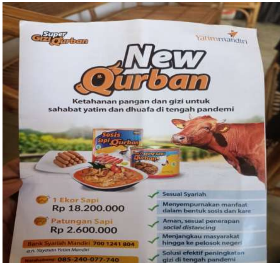
Gambar 4.5 Brosur Super Gizi Qurban