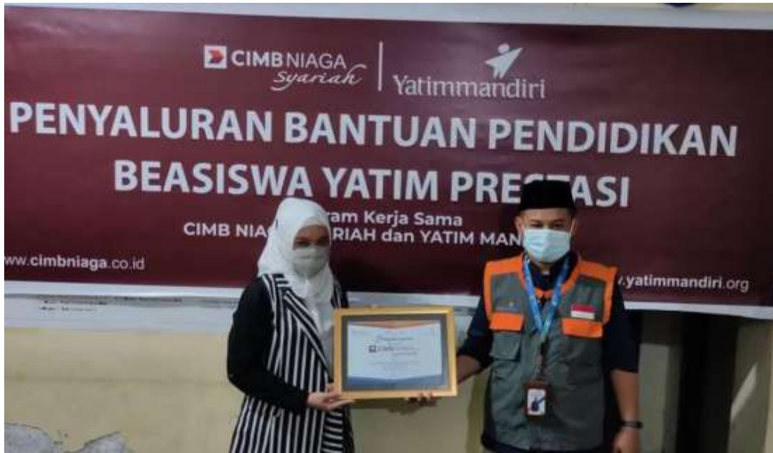
Gambar 4.3 Pendistribusian Bantuan Beasiswa Yatim Prestasi