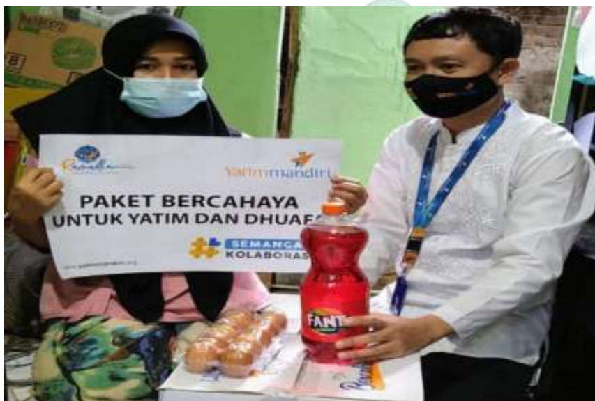
Gambar 4.11 Program Penyaluran Paket Bercahaya