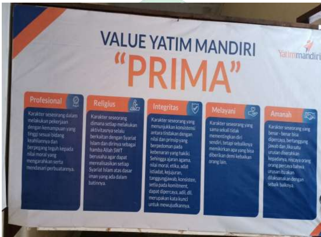
Gambar 4.1 Value Yatim Mandiri Makassar