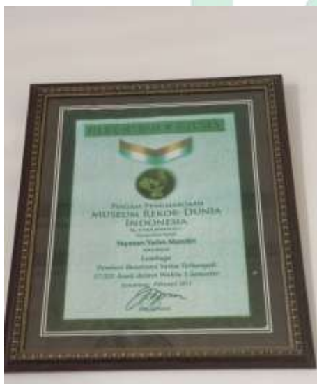
Gambar 6 Piagam Penghargaan Sebagai Pemberi Beasiswa Terbanyak