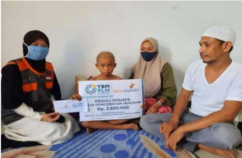
Gambar 4.8 Program Bantuan Langsung Mustahik