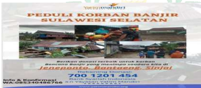
Gambar 4.7 Program Bantuan Bencana Alam