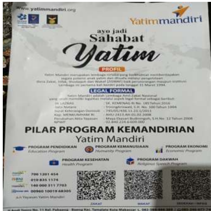
Gambar 4.2 Brosur Yatim Mandiri