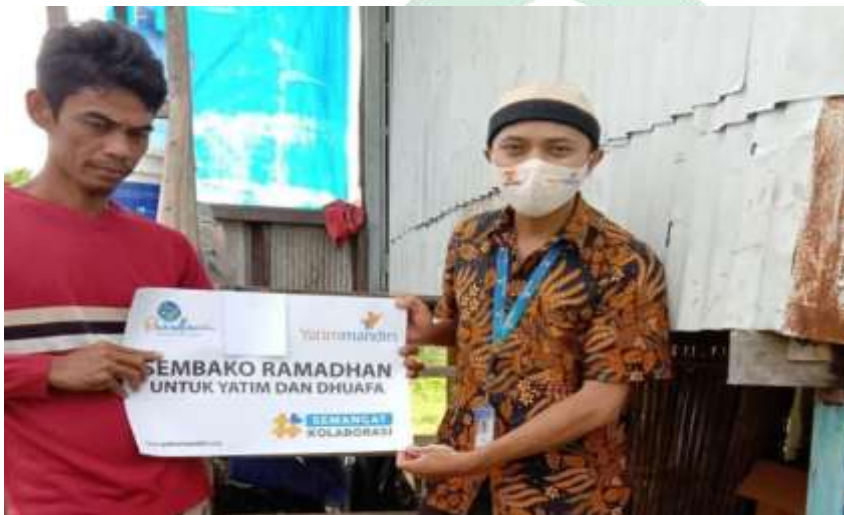
Gambar 4.10 Program Penyaluran Sembako Ramadhan