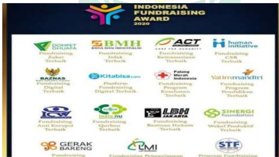
Gambar 4 Prestasi Yatim Mandiri sebagai Fundraising Program Pendidikan Terbaik.