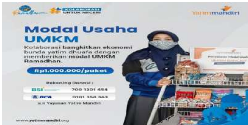
Gambar 4.6 Program Bunda Mandiri Sejahtera