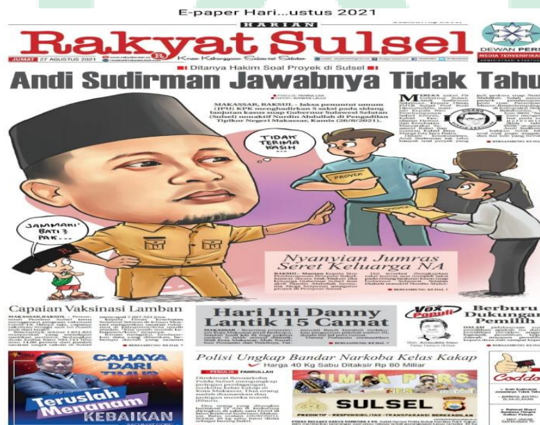
Gambar 4.4 headline edisi 27 Agustus 2021 Harian Rakyat Sulsel