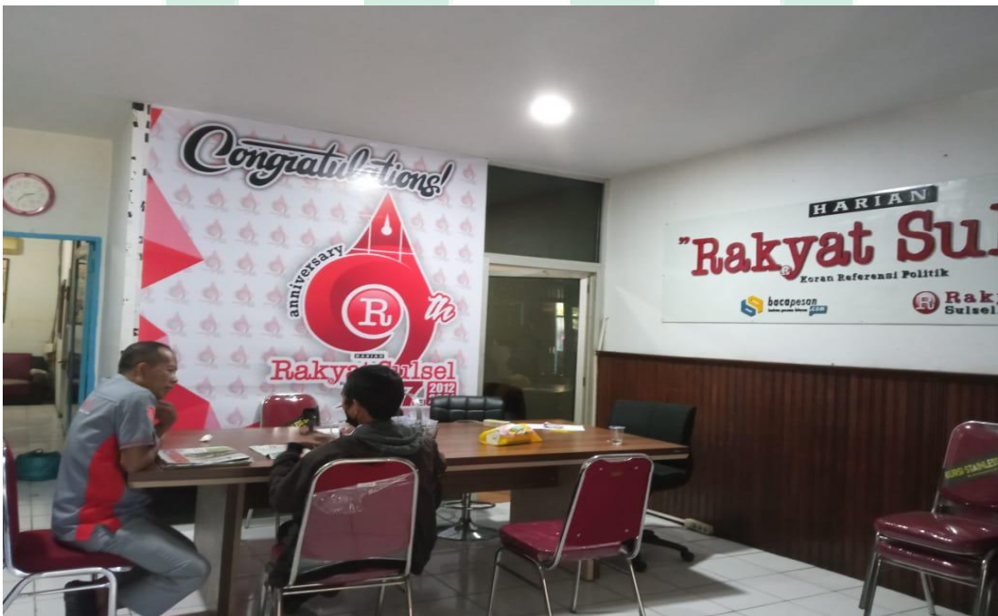
Gambar VI. Ruang Rapat Redaksi