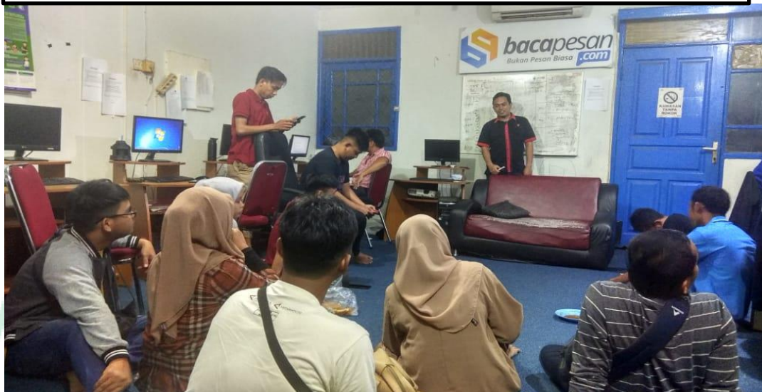
Gambar IV. Rapat Redaksi Harian Rakyat Sulsel