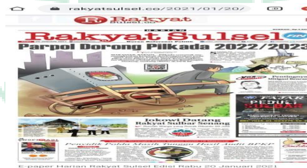
Gambar 1.1 Berita Politik

Berita politik adalah suatu informasi yang berkaitan dengan penyelenggaraan pemerintahan dan Negara. Berikut salah satu contoh berita politik yang ada di Harian Rakyat Sulsel: