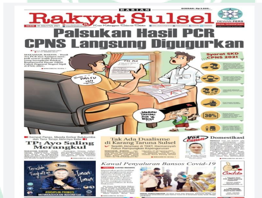
Gambar 4.5 headline edisi 30 Agustus 2021 Harian Rakyat Sulsel

Edisi Senin 30 Agustus yang berjudul Palsukan Hasil PCR CPNS Langsung Digugurkan . Isi dari edisi ini yakni hasil tes PCR dan Antigen menjadi syarat wajib peserta yang mengikuti Seleksi Kompetensi Dasar (SKD) Calon Pegawai Negeri Sipil (CPNS) 2021. Para peserta wajib membawa surat keterangan hasil negative Covid-19, peserta yang memalsukan surat keterangan hasil swab tes RT PCR atau rapit test antigen bakal didiskualifikasi atau gugur. Sebagaimana yang dijelaskan pada gambar headline Harian Rakyat Sulsel edisi 27 Agustus 2021.