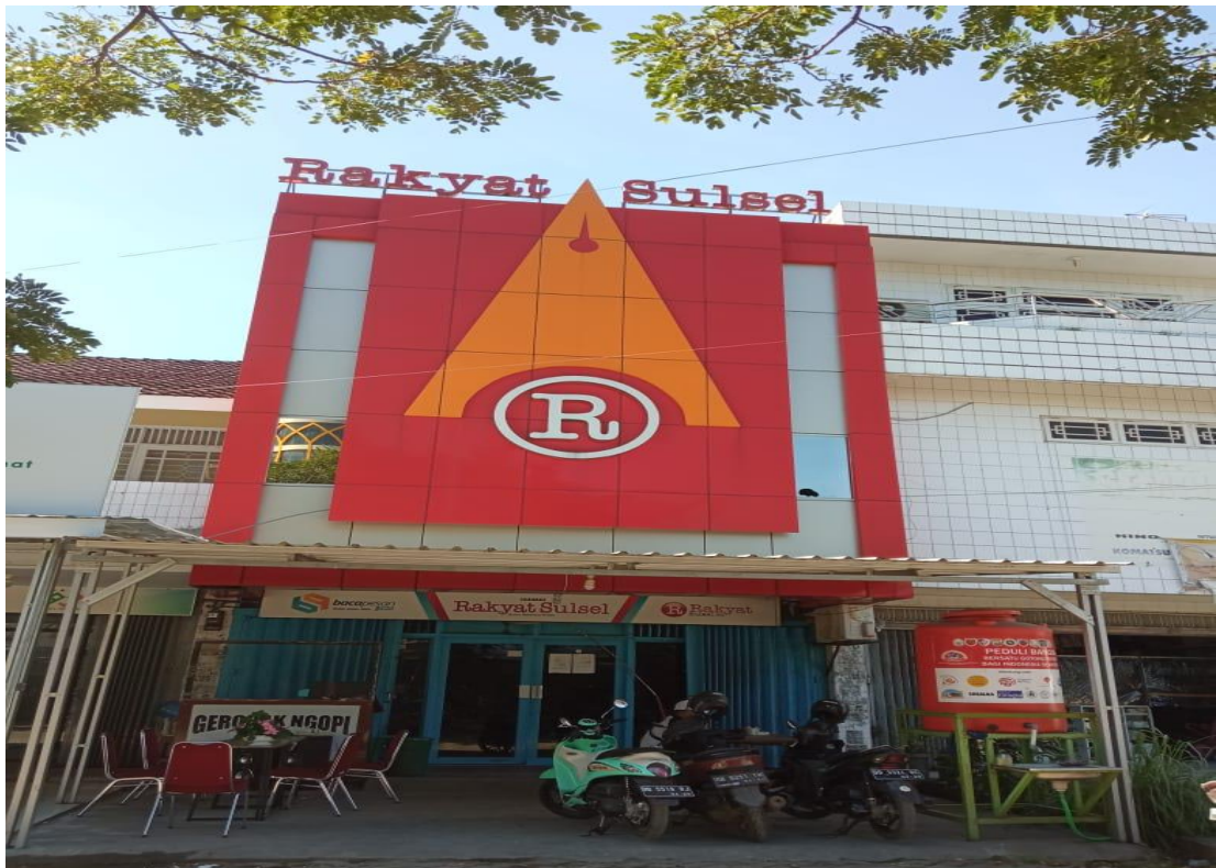
Gambar VII. Kantor Harian Rakyat Sulsel

UNIVERSITAS ISLAM NEGERI ALAUDDIN MAKASSAR