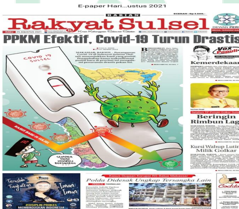
Gambar 4.3 headline edisi 25 Agustus 2021 Harian Rakyat Sulsel

Edisi Rabu 25 Agustus 2021 yang berjudul PPKM Efektif, Covid-19 Turun Drastis . Dalam edisi ini, penanganan Covid-19 di Sulawesi Selatan menunjukkan hasil yang positif. Penambahan kasus terkonfirmasi positif mengalami penurunan drastis di Sulsel. Adanya penurunan jumlah kasus sejak penepatan PPKM level 4 yang diterapkan selama 2 minggu di Sulsel, dengan turunnya angka kasus Covid-19 menyebabkan perubahan kebijakan dari sebelumnya yakni mall atau pusat perbelanjaan yang sebelumnya ditutup saat ini sudah mulai beroperasi dengan kapasitas pengunjung maksimal 50%. Sebagaimana yang dijelaskan pada gambar headline Harian Rakyat Sulsel edisi 25 Agustus 2021.