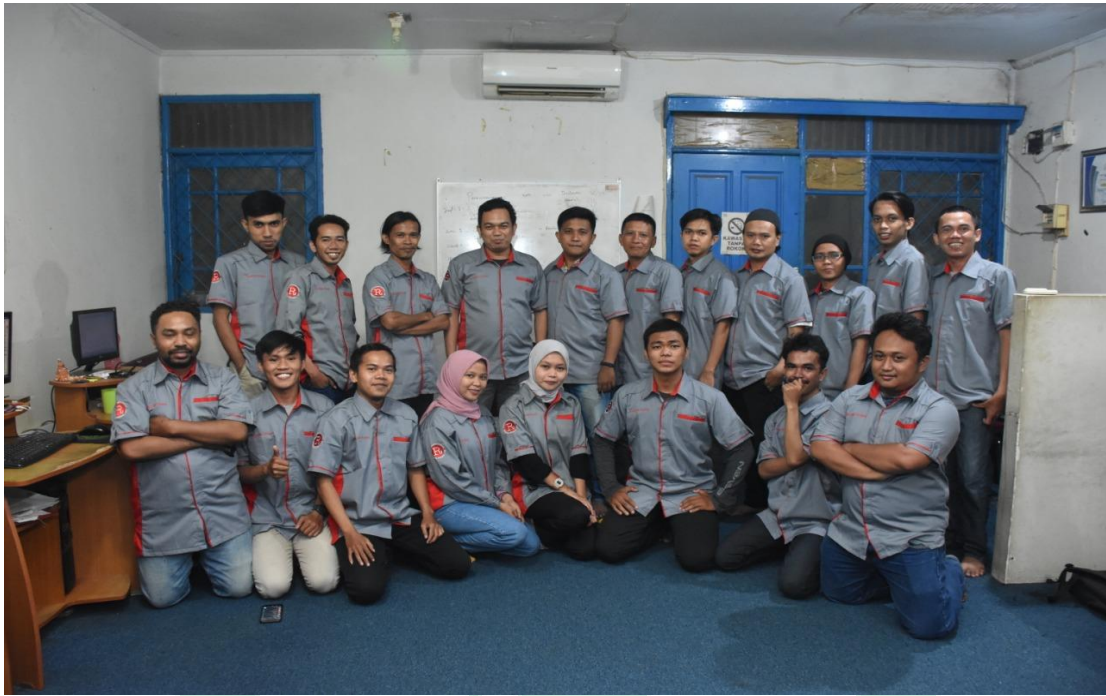
Gambar V. Crew Harian Rakyat Sulsel