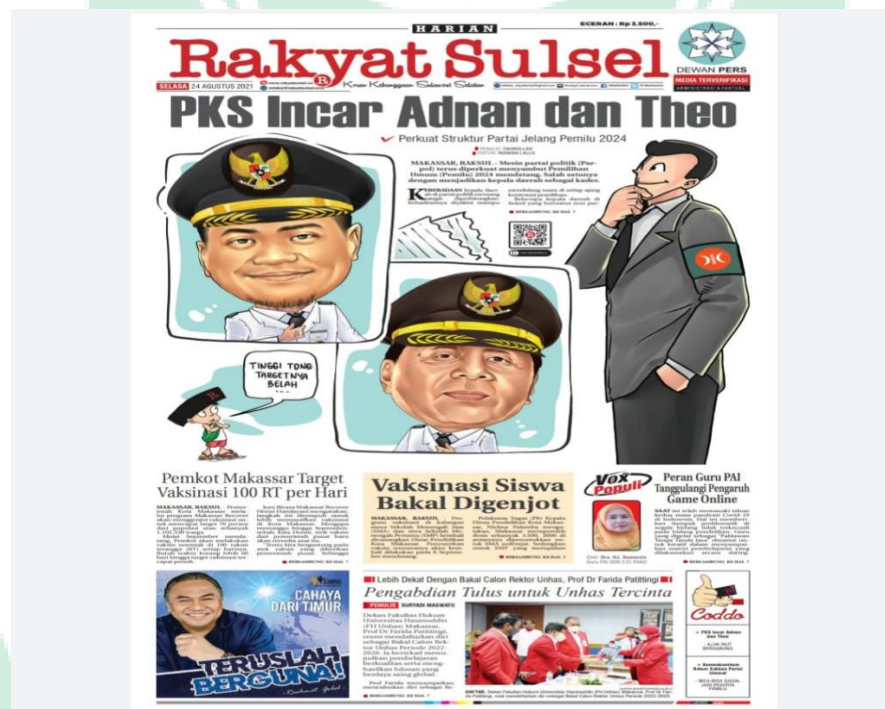
Gambar 4.2 headline edisi 24 Agustus 2021 Harian Rakyat Sulsel

Edisi Selasa 24 Agustus 2021 yang berjudul PKS Incar Adnan dan Theo . Dalam edisi ini, memuat tentang partai politik yang terus diperkuat menyambut pemilihan umum (Pemilu) 2024 mendatang. Salah satunya dengan menjadikan kepala daerah sebagai kader. Keberadaan kepala daerah di partai politik memang sangat diperhitungkan. Kehadirannya diyakini mampu mendulang suara di setiap ajang kontestasi pemilihan. Sebagaimana yang dijelaskan pada gambar headline Harian Rakyat Sulsel edisi 25 Agustus 2021.