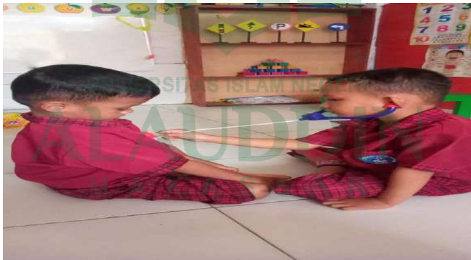
Kegiatan Bermain Peran Dokter-dokteran