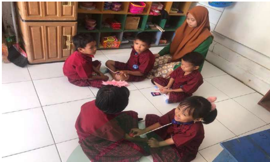
Kegiatan Bermain Peran Posttest