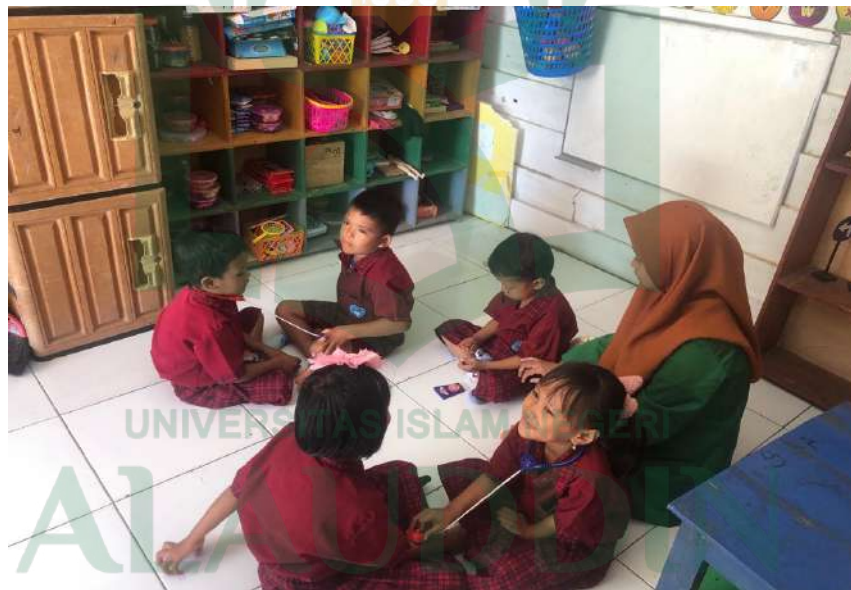
Kegiatan Bermain Peran Pretest