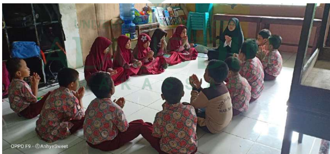
Pelatihan/Training Guru Al-Qur'an