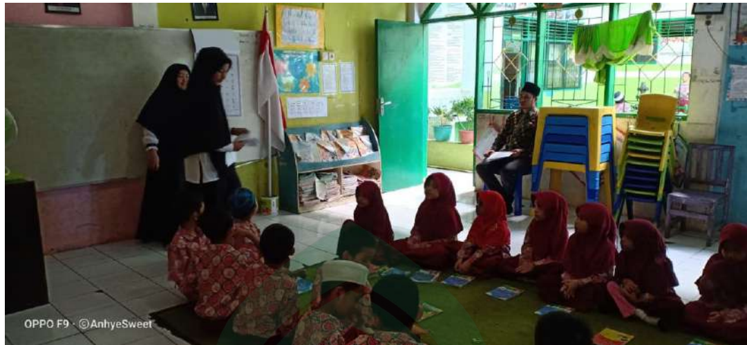
(Observasi Penerapan Metode Wafa )