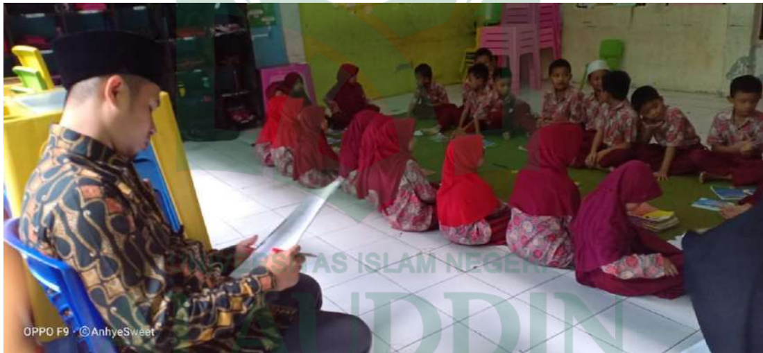
(Observasi Penerapan Metode Wafa )