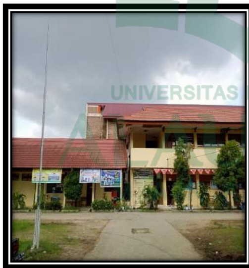
Gambar Gedung Sekolah MTs Madani Alauddin