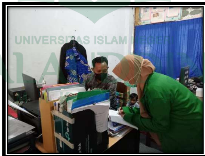
Meminta data kepada ketua TU terkait dengan profil MTs Madani Alauddin Paopao