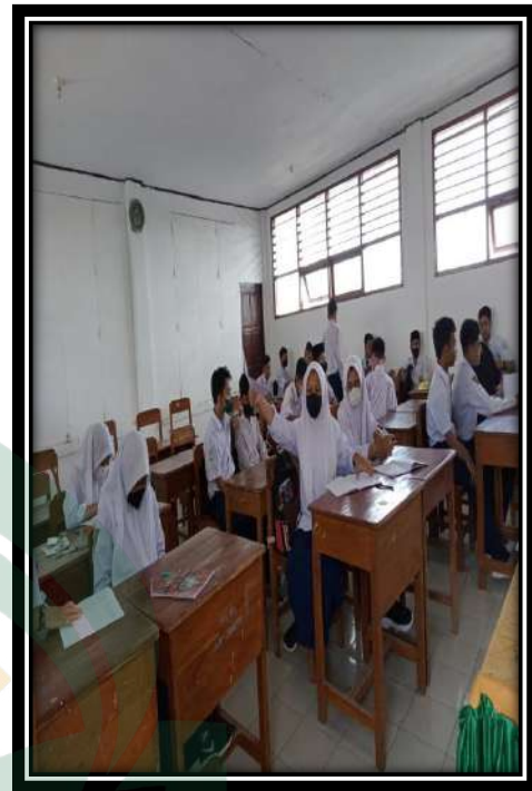
Pembelajaran Fiqih peserta didik di dalam kelas