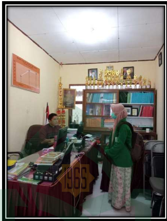
Meminta izin kepada kepala sekolah untuk meneliti pada tanggal 11 Februari 2022