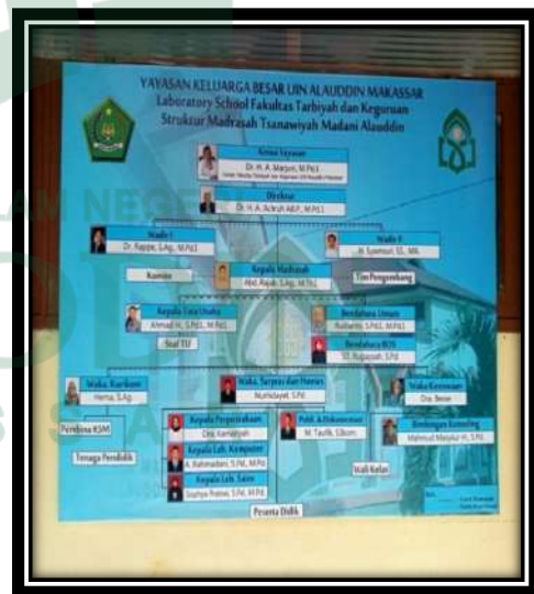
Gambar struktur organisasi MTs Madani Alauddin