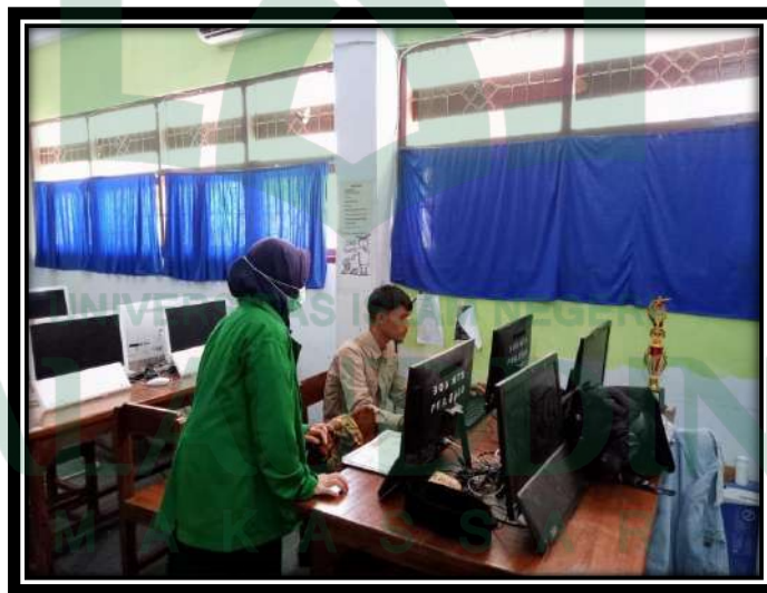
Wawancara terkait kegiatan ekstarkurikuler di MTs Madani Alauddin