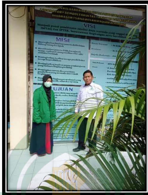
Foto bersama dengan kepala sekolah pasca wawancara terkait dengan data pembelajaran daring.