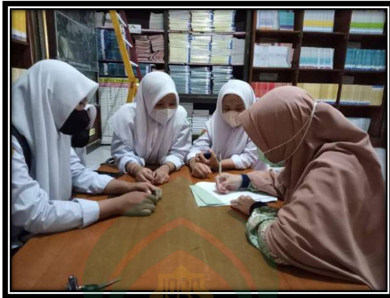
Wawancara dengan peserta didik kelas IX