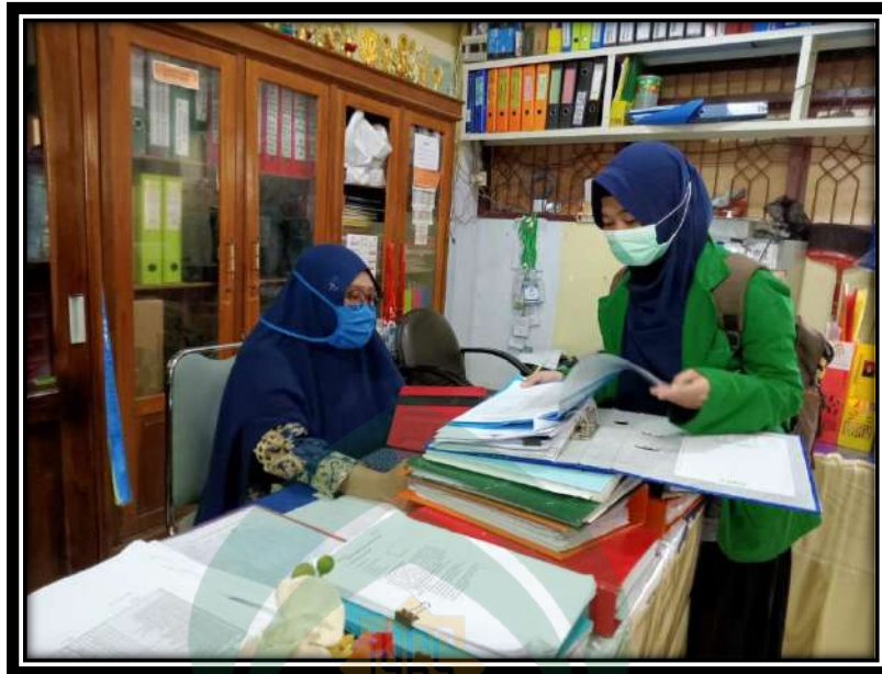
Wawancara keadaan peserta didik