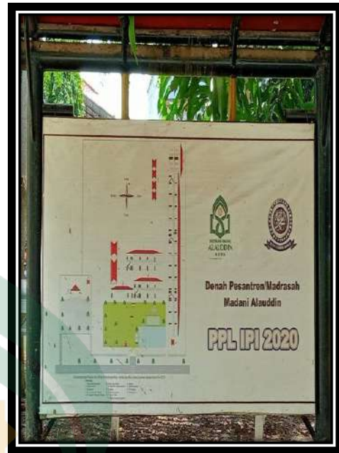
Visi-misi MTs Madani Alauddin