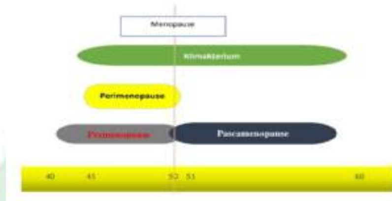
Gambar 2.1 Fase-Fase Menopause