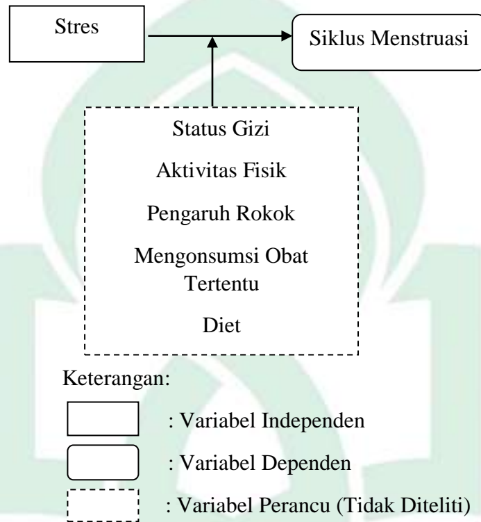
Bagan 2.2 Kerangka Konsep

Kerangka konsep penelitian merupakan tautan atau hubungan yang membantu peneliti menghubungkan data ke teori dengan menggambarkan hubungan antar variabel (Nursalam, 2018).