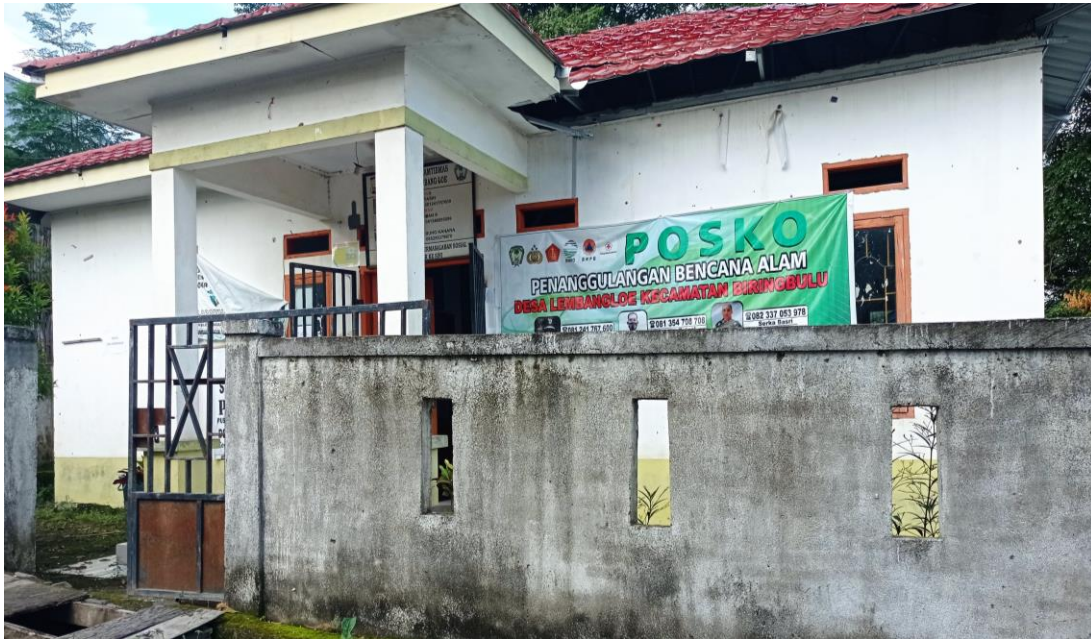
Kantor Desa Lembangloe Kecamatan Biringbulu Kabupaten Gowa