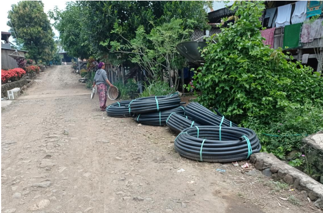
Pipa-pipa yang akan digunakan untuk mendistribusikan air ke warga di Dusun Lappara Desa Lemblang Kecamatan Biringbulu Kabupaten Gowa