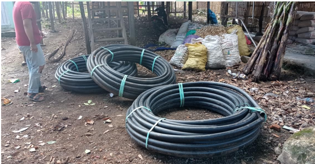
Pipa-pipa yang akan digunakan untuk mendistribusikan air ke warga di Dusun Bontomanai Desa Lemblang Kecamatan Biringbulu Kabupaten Gowa