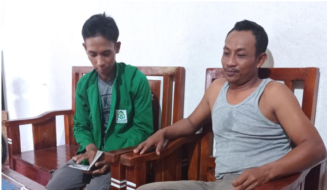
Wawancara dengan Dg Said Masyarakat pengguna air bersih dari Desa Lembangloe ( Tanaberu 17 Mei 2021)