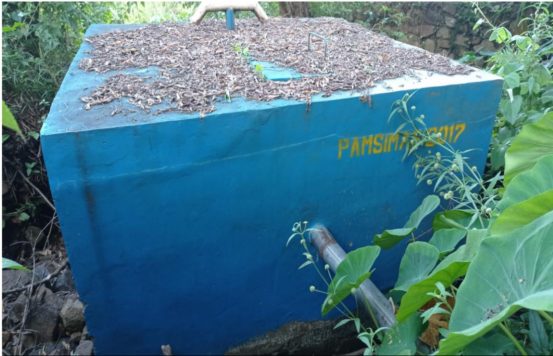
Penampungan Air di Sumber air Desa Lembangloe Kecamatan Biringbulu Kabupaten Gowa di Bangun Tahun 2017