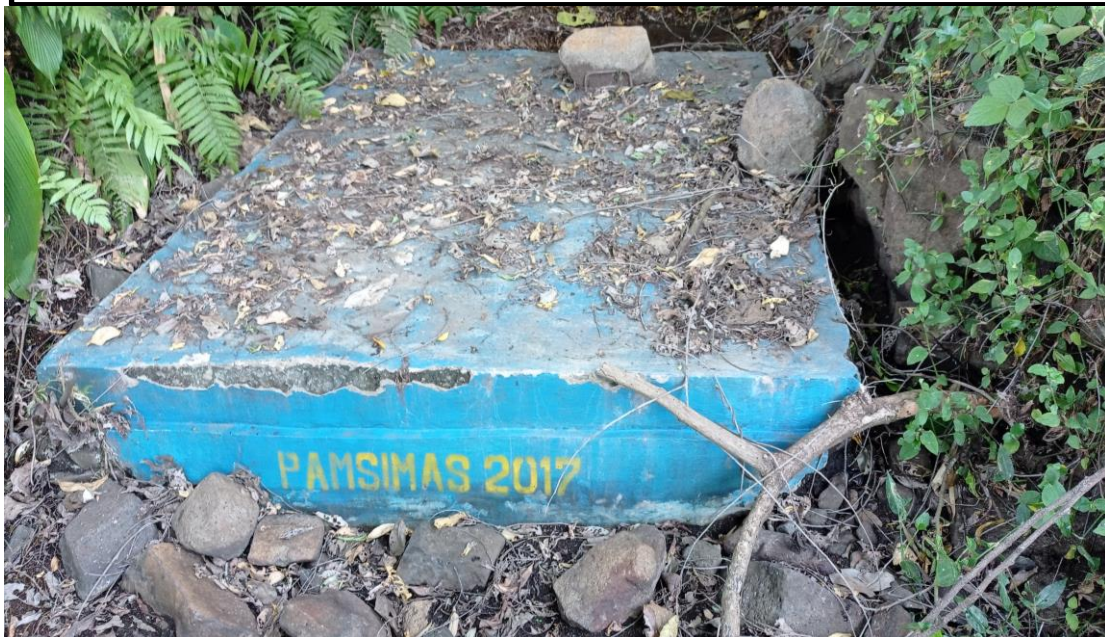
Sumber air Desa Lembangloe Kecamatan Biringbulu Kabupaten Gowa di Bangun Tahun 2017