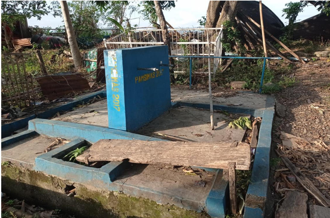
Hidran Umum (HU) Desa Lembangloe Kecamatan Biringbulu Kabupaten Gowa di bangun Tahun 2017