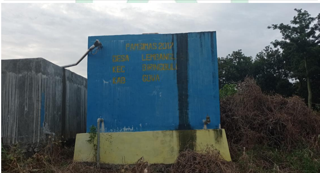
Penampungan Air bersih yang dari gunung yang selanjutnya di salukan ke warga d Desa Lembangloe di bangun Tahun 2017