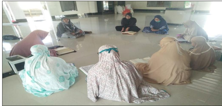
Belajar Tahsin dan tajwid Alqur'an, pada hari/Tanggal, Rabu, 28 April 2021.