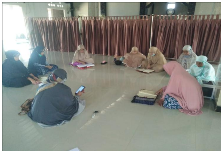
Pelaksanaan Majelis Taklim Permata desa Timbuseng, hari/Tanggal, Rabu, 28 April 2021.