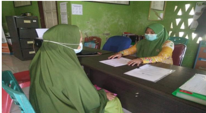
Pengantaran surat penelitian di kantor desa Timbuseng hari/Tanggal, Jumat, 9 April 2021.