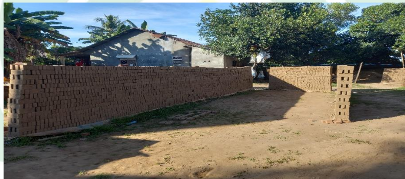
Pengangkutan masuk kepenampungan