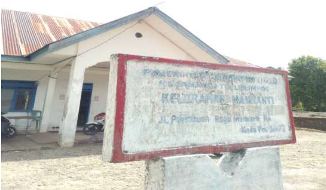
Gambar 1: Kantor Kelurahan Manananti Kecamatan Tellulimpoe Kabupaten Sinjai