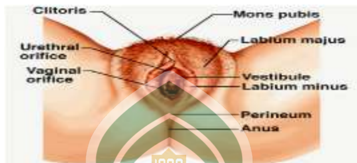
Gambar 2.2 Genitalia Eksterna

Perineum terletak antara vulva dan anus, panjangnya rata-rata 4 cm (Prawirohardjo, 2008).