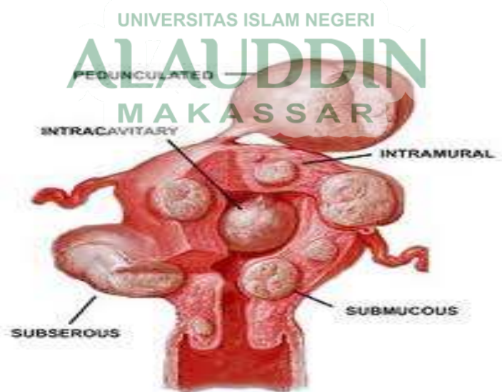
Gambar 2.3 Letak mioma uteri