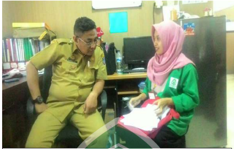
Gambar 7. Wawancara dengan informan