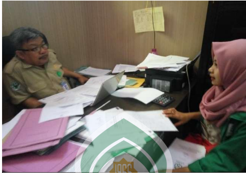
Gambar 3. Wawancara dengan informan