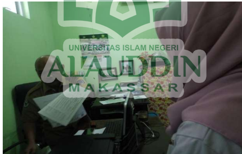
Gambar 4. Pengambilan data