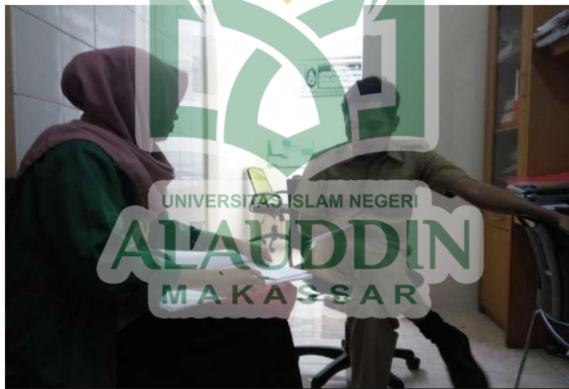
Gambar 6. Wawancara dengan informan