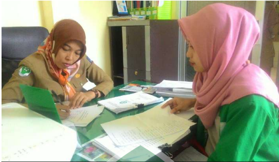
Gambar 9. Wawancara dengan informan