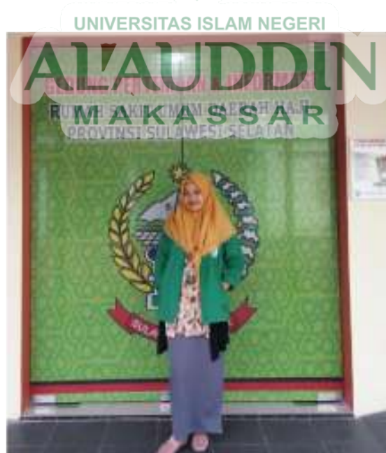
Gambar 2. Lokasi Penelitian