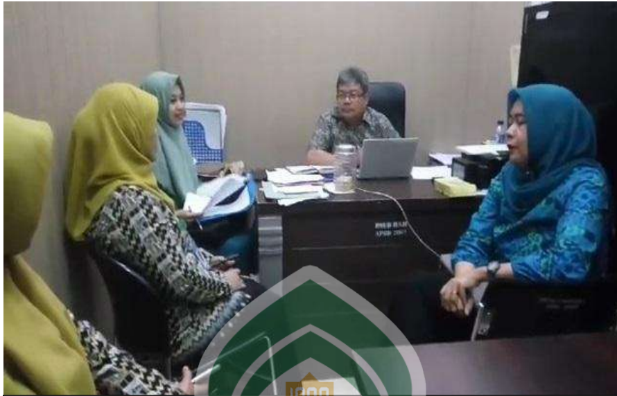
Gambar 11. FGD ( Focus Group Discussion )