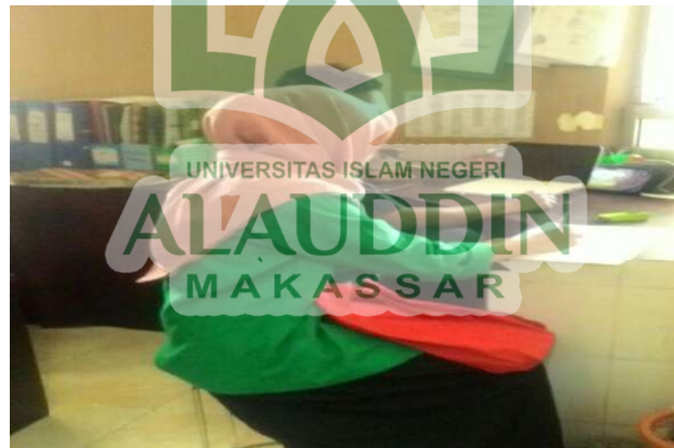
Gambar 8. Wawancara dengan informan