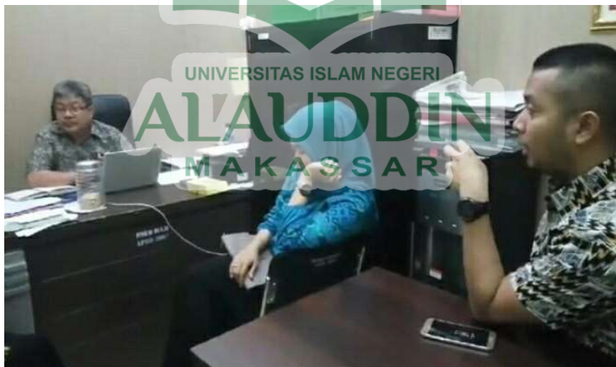
Gambar 12. FGD ( Focus Group Discussion )