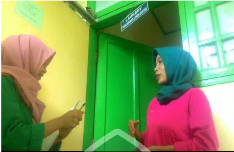
Gambar 5. Wawancara dengan informan