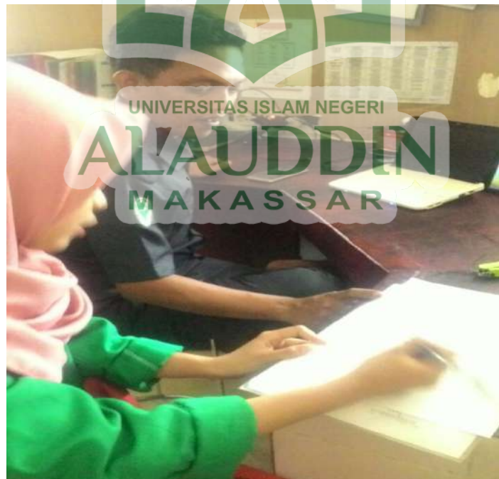
Gambar 10. Pengambilan Data