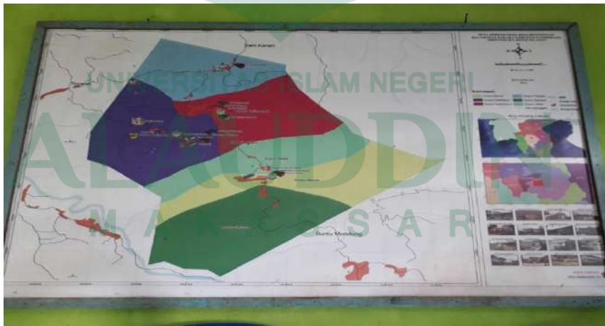
Peta wilayah Desa Bontongan