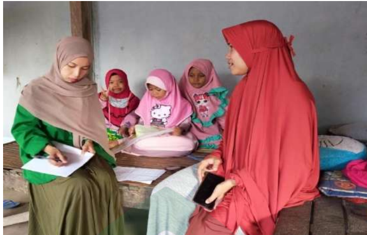
Proses kegiatan belajar al-Qur'an