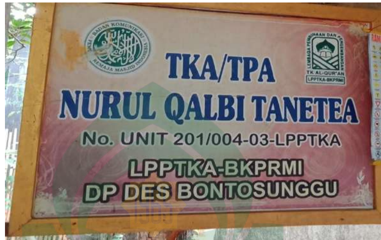
Papan nama unit dan papan tulis