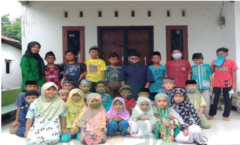
Foto bersama Para Santri