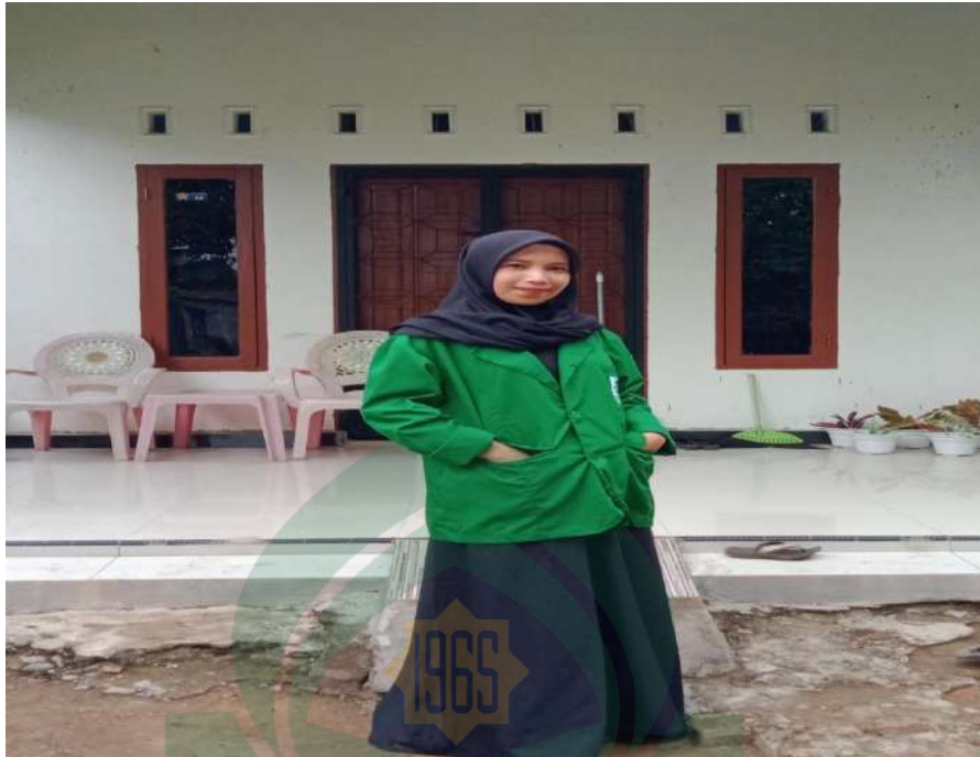
Foto pada saat observasi