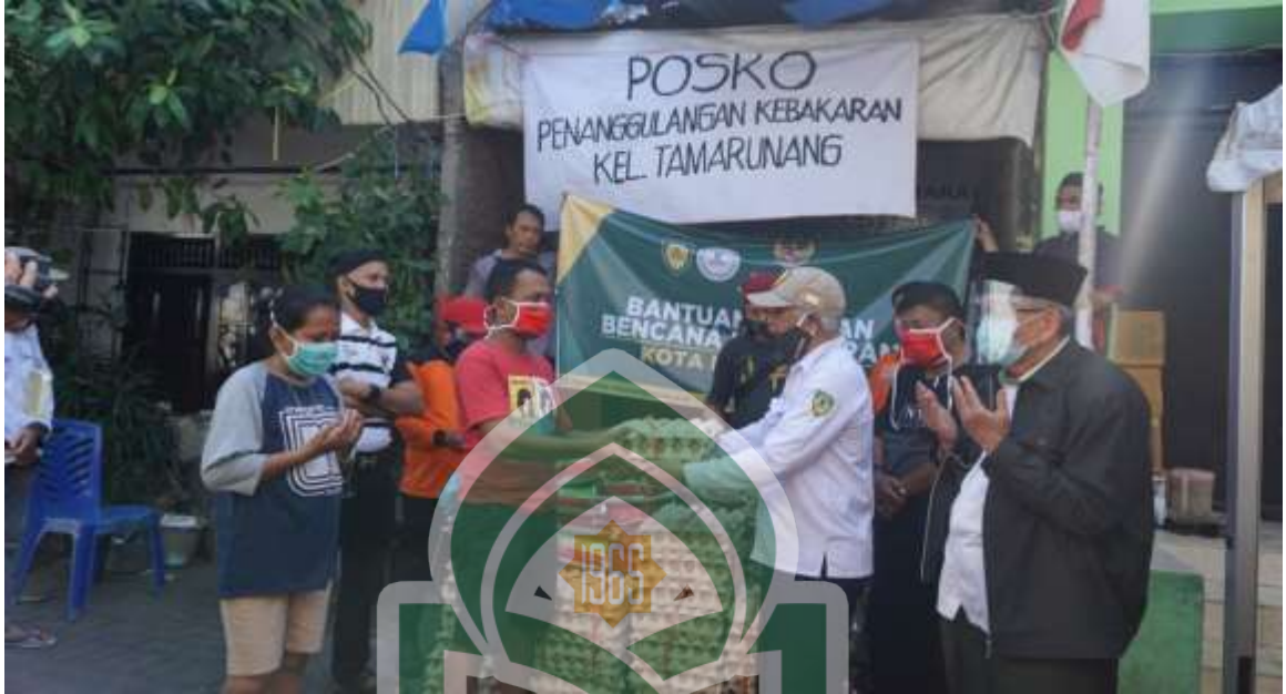
Proses pendistribusian yang dilakukan oleh Baznas Kota Makassar