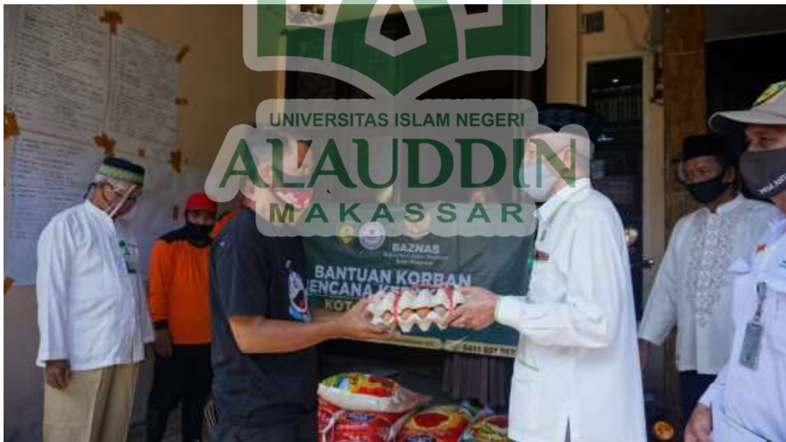
Proses pendistribusian yang dilakukan oleh Baznas Kota Makassar.