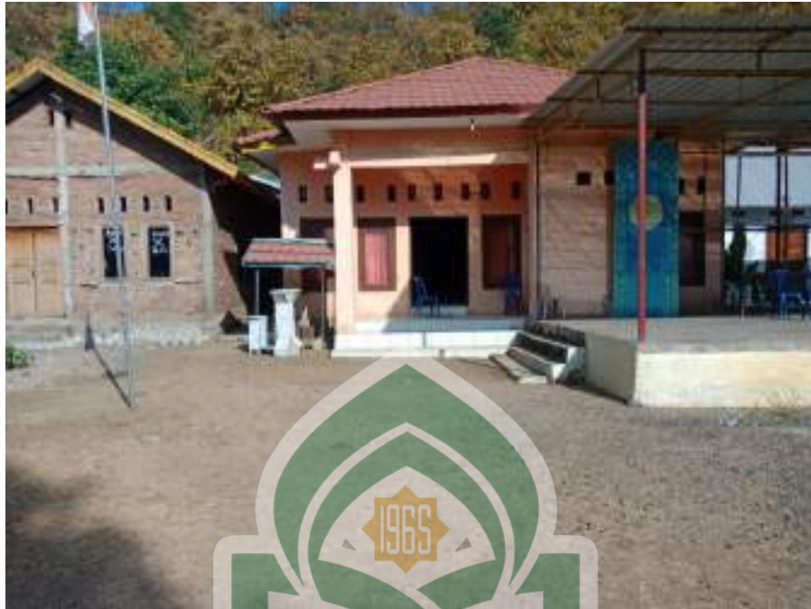
Gambar 1.1 Kantor Desa Nunggi