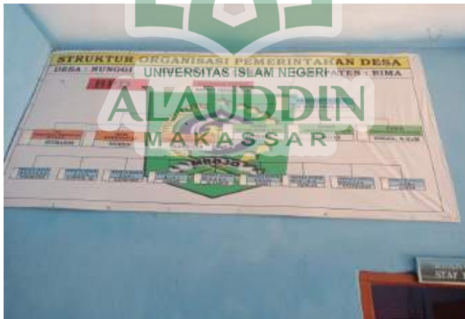
Gambar 2.1 Struktur Organisasi Pemerintahan Desa Nunggi, gambar diambil Pada Tanggal 16 Juli 2021.