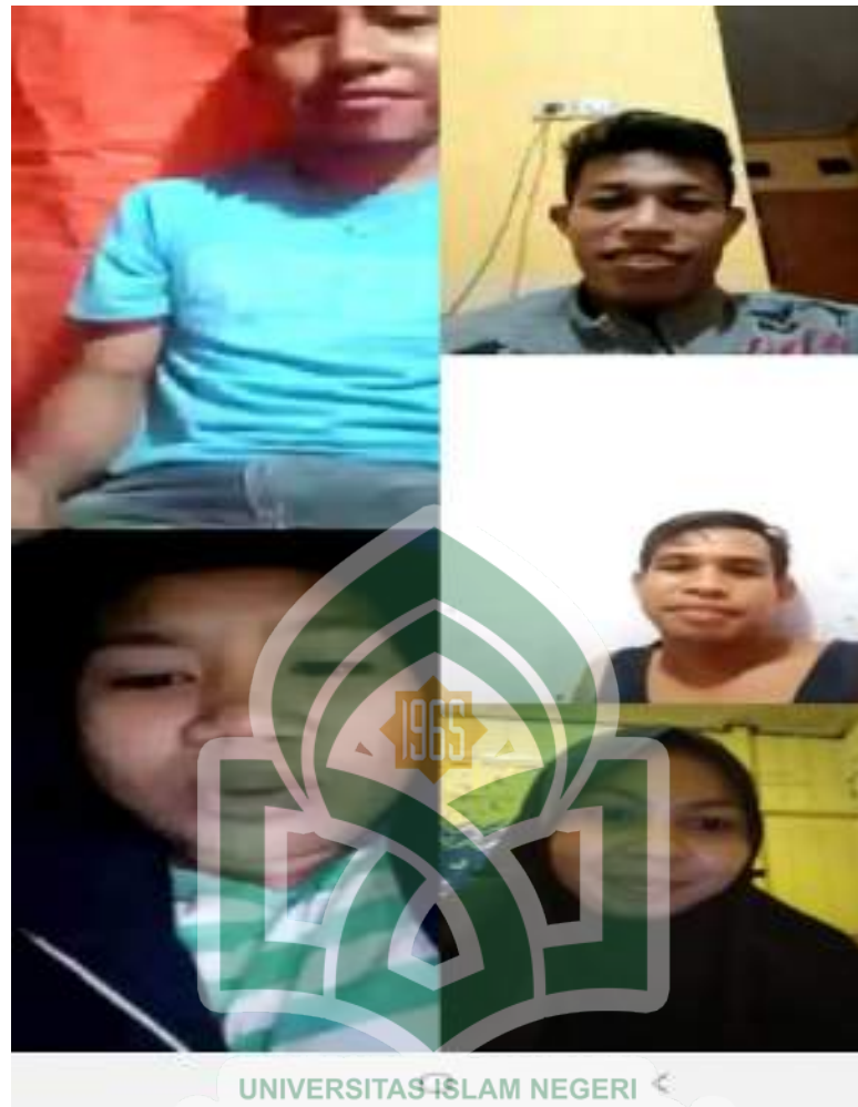
Gambar 8. 1 Hasil tangkapan layar dengan para pelaku londoiha (kawin lari) pada tanggal 21 Juli 2021.