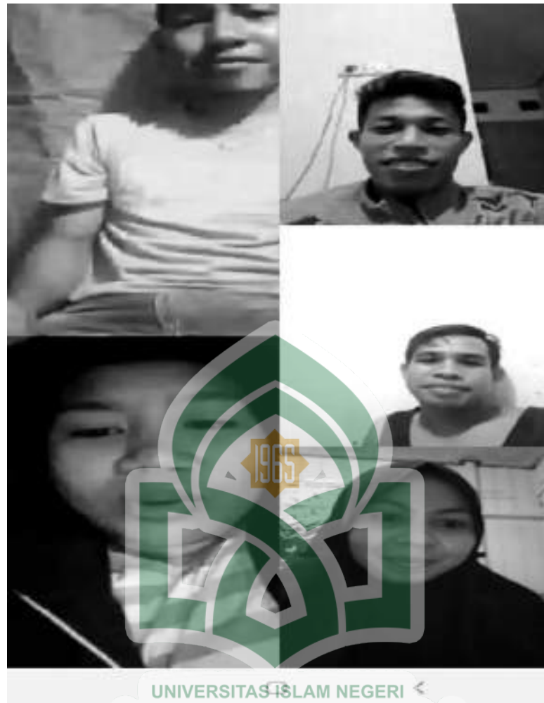
Gambar 8. 1 Hasil tangkapan layar dengan para pelaku londoiha (kawin lari) pada tanggal 21 Juli 2021.