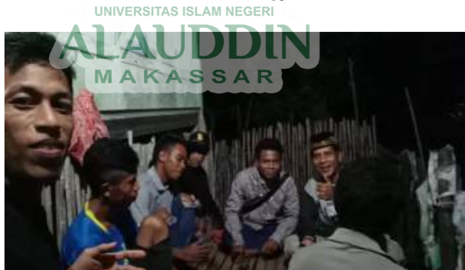
Gambar 7. 1 Foto Bersama salah satu (Tokoh Masyarakat dan para pemuda), Pada Tanggal 18 Juli 2021