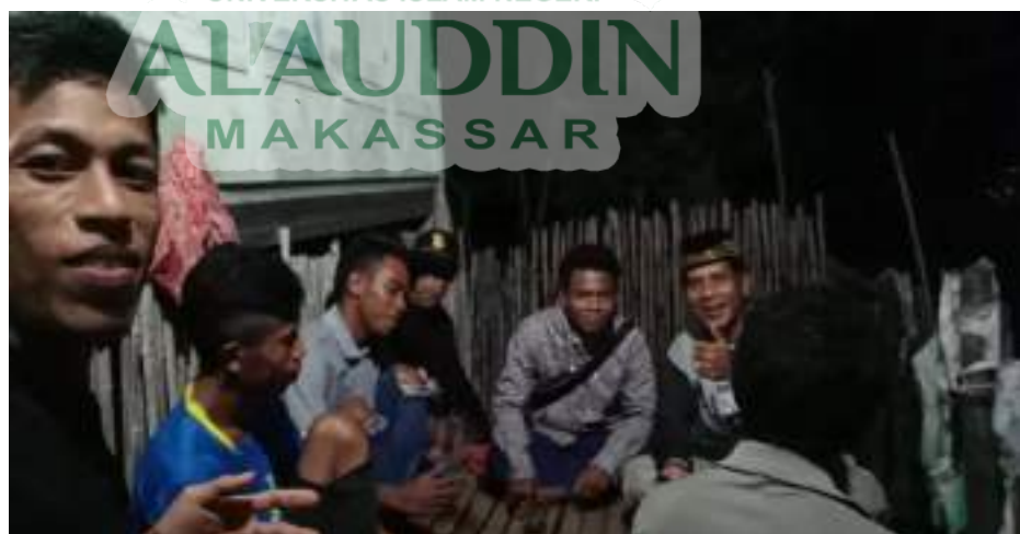
Gambar 7. 1 Bersama dengan salah satu (Tokoh Masyarakat dan para pemuda Desa Nunggi), Pada Tanggal 18 Juli 2021