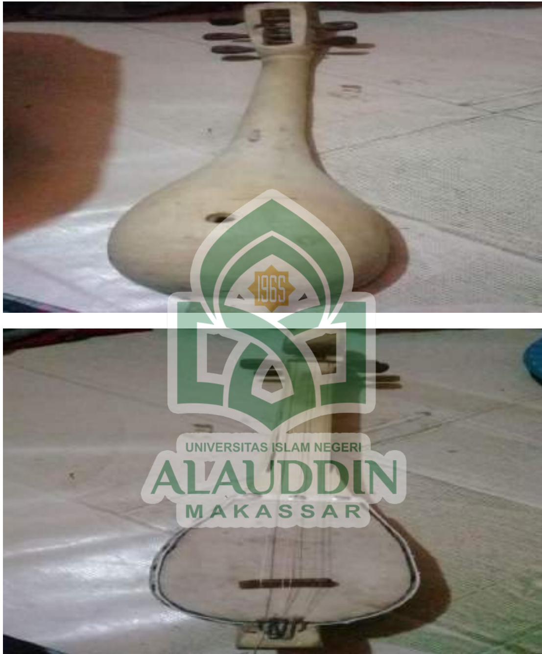
Gambar 5: Gambo