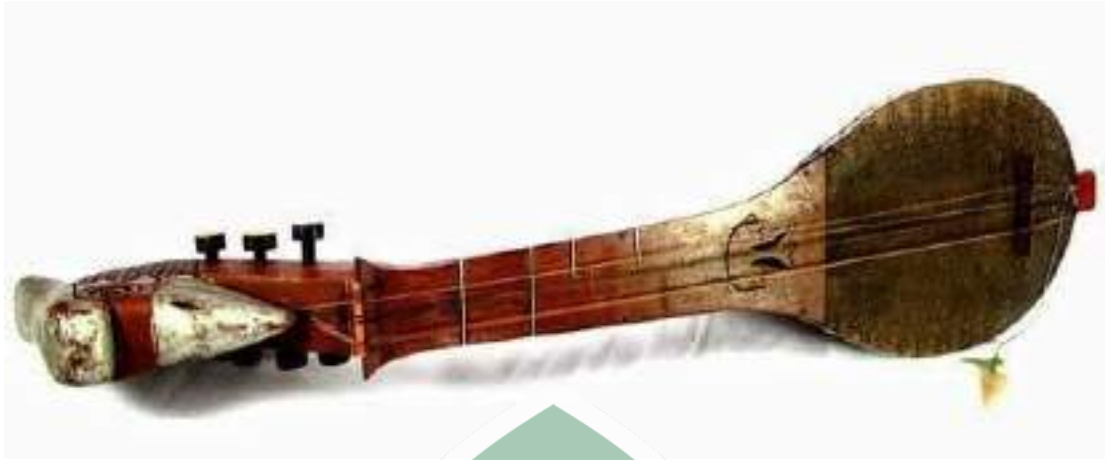
Gambar 4: Gambo