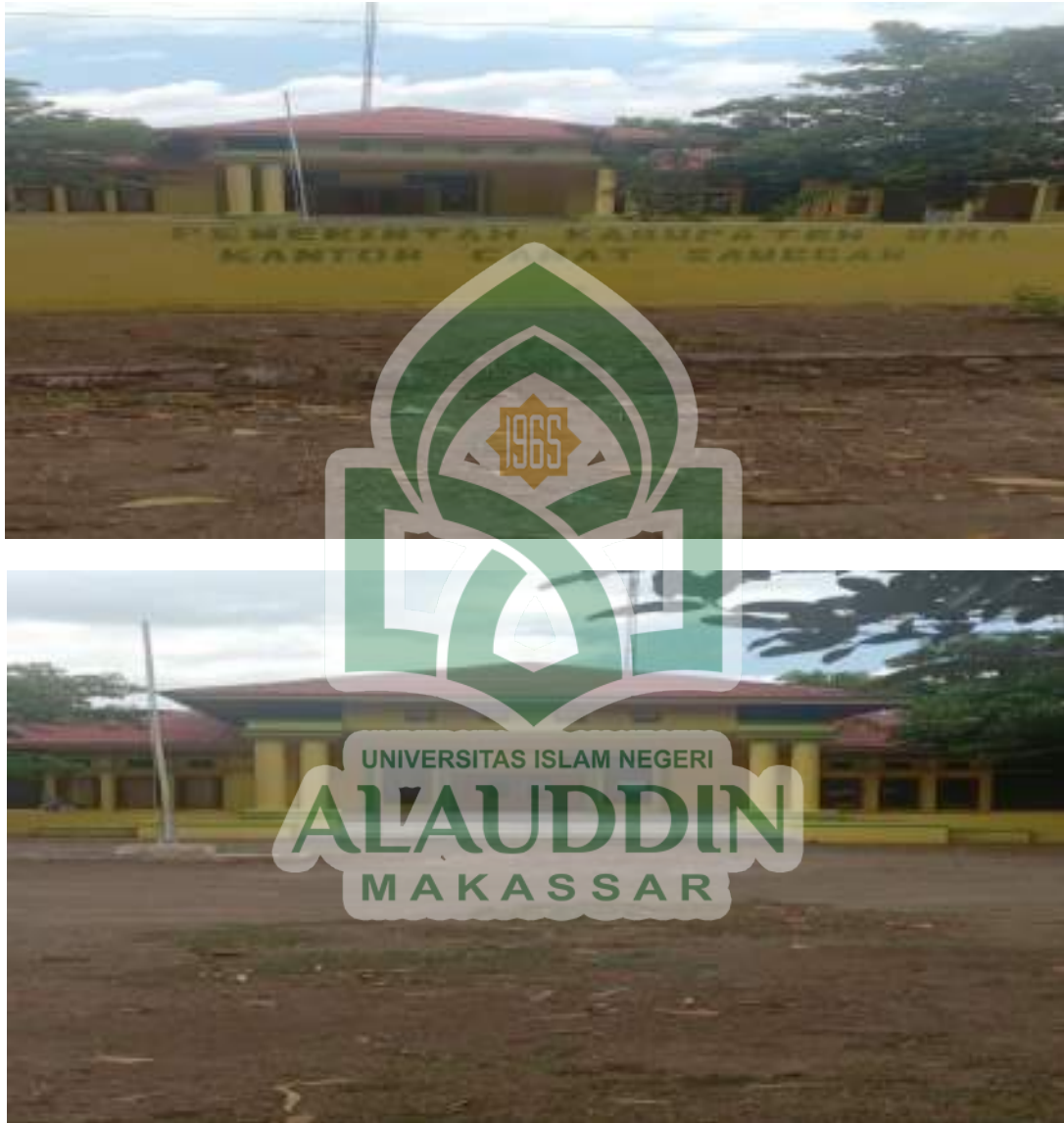
Gambar: Kantor Camat Sanggar