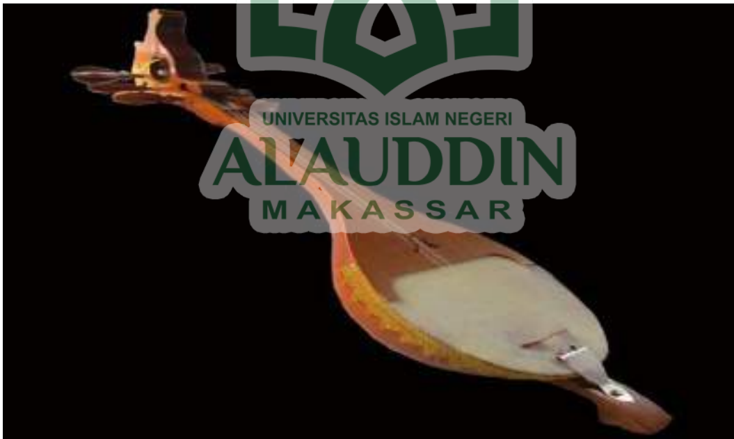
Gambar 3: Gambo