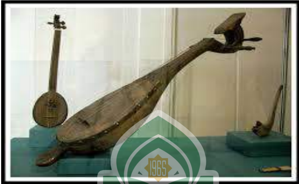
Gambar 2: Gambo