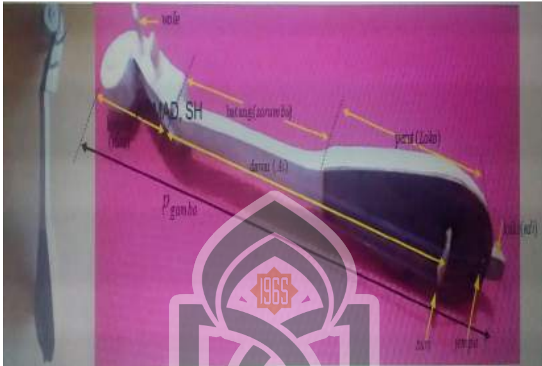
Gambar: Bentuk Gambo dan Keterangan Gambo

Bahan dasar gambo dibuat dari kayu Nara , menurut masyarakat Sanggar sejenis kayu Sonokeling berwarna kuning atau jenis kayu yang lain adalah kayu Nangka dan kayu Rida.