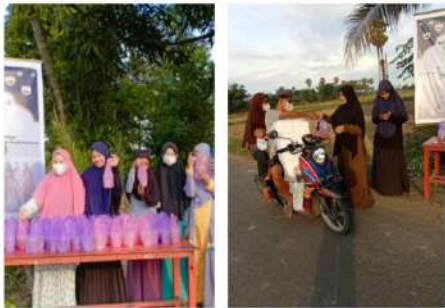
Kegiatan bagi-bagi takjil 20 April 2022