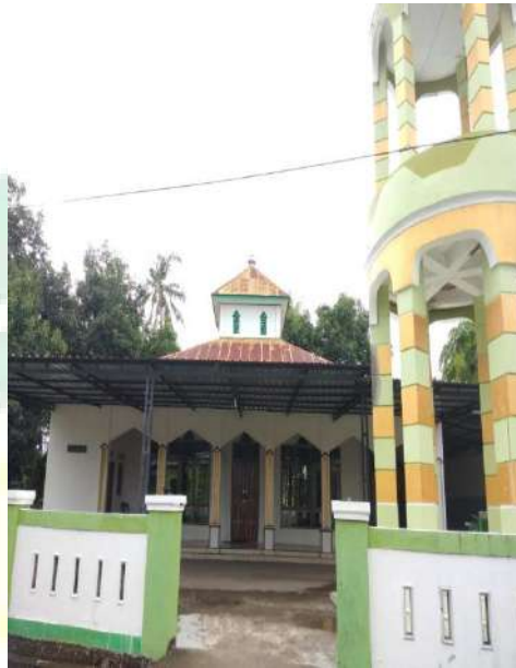
Masjid Al-Ikhlas Tamalate