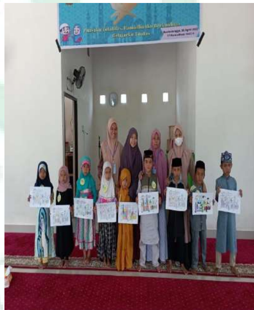
Kegiatan Ramadhan 25 April 2022