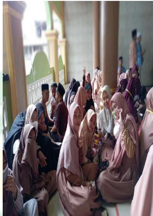
Kajian Ahad Pagi 05 Juni 2022