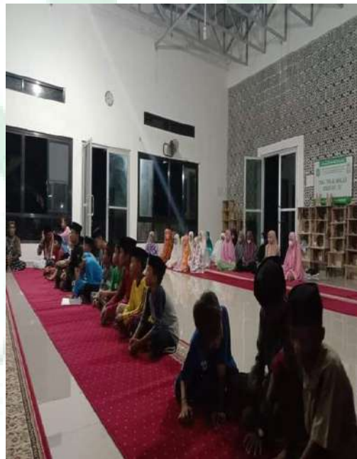
Bimbingan membaca Al-qur'an