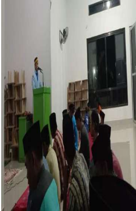
Kegiatan Ceramah Umum 03 Juni 2022