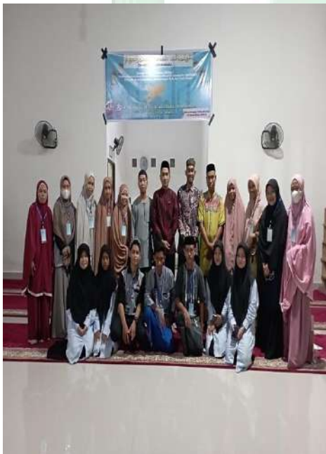
Peringatan Isra' Mi'raj