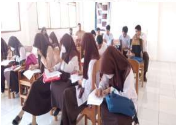
Gambar 3. Peserta didik sedang mengisi angket