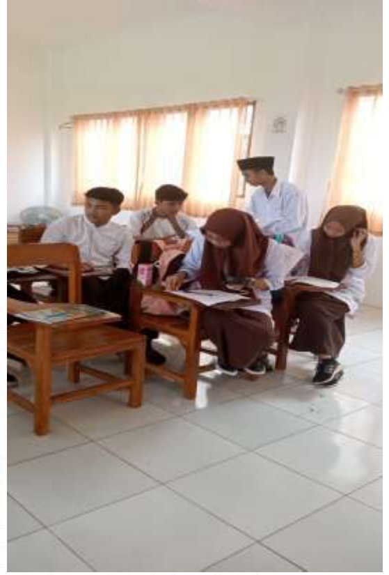
Gambar 2. Sedang memantau pengisian angket