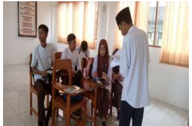
Gambar 4. Sedang mengumpulkan angket