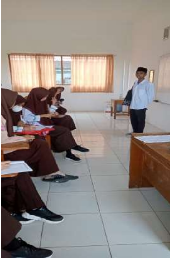
Gambar 1. Sedang menjelaskan cara mengisi angket