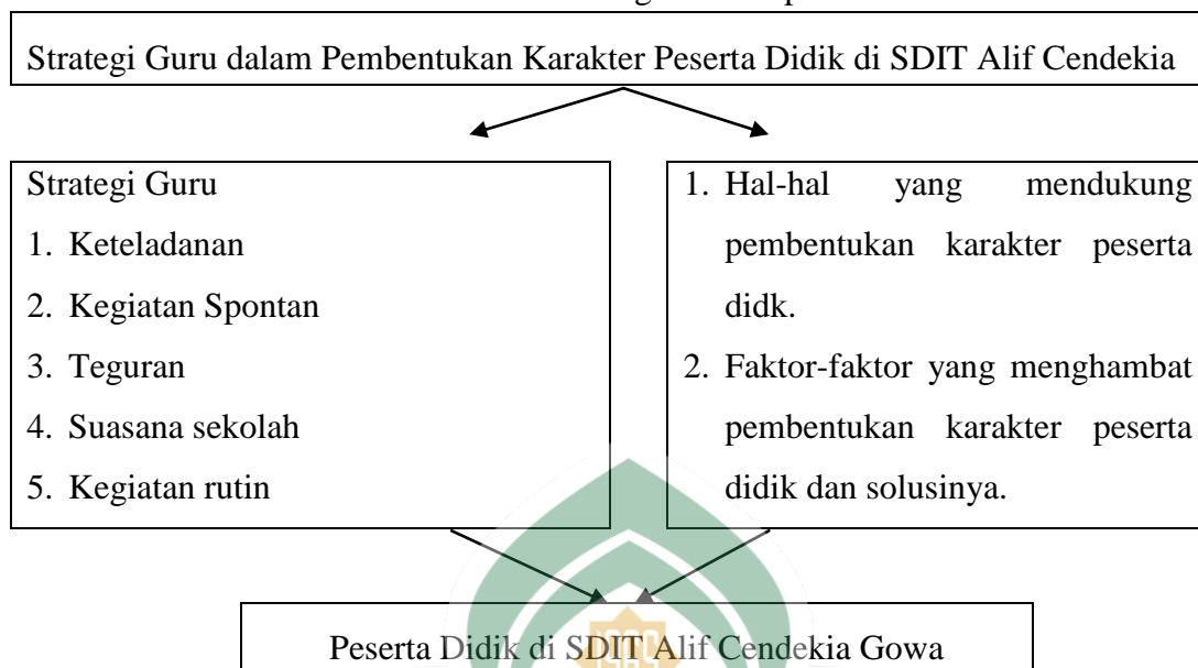
Gambar 2.1. Kerangka Konseptual