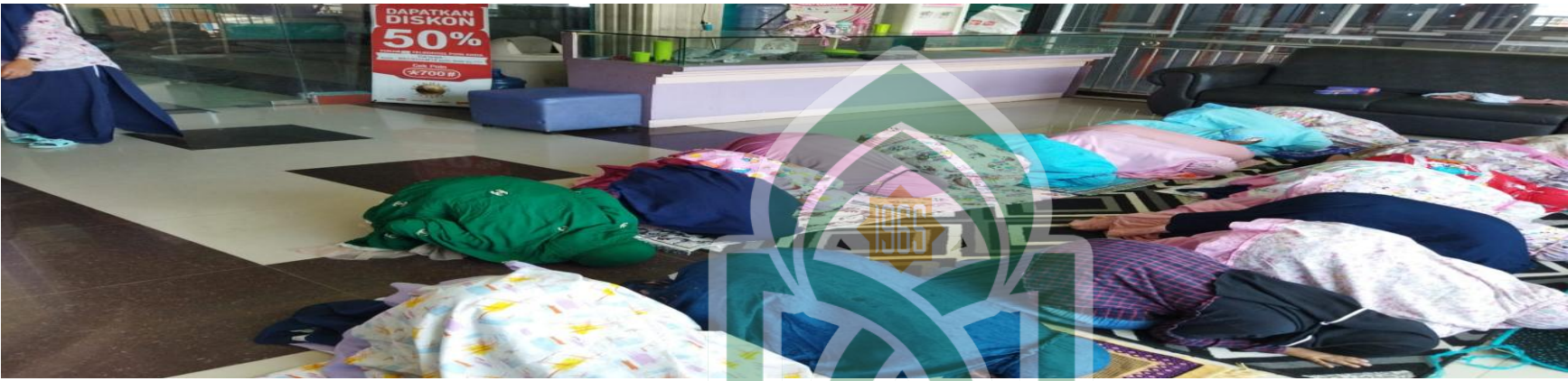
Pelaksanaan salat duha