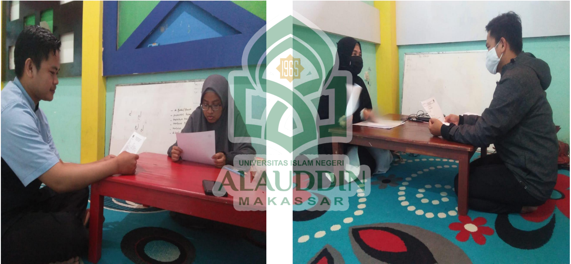
Wawancara dengan Guru SDIT Alif Cendekia Gowa