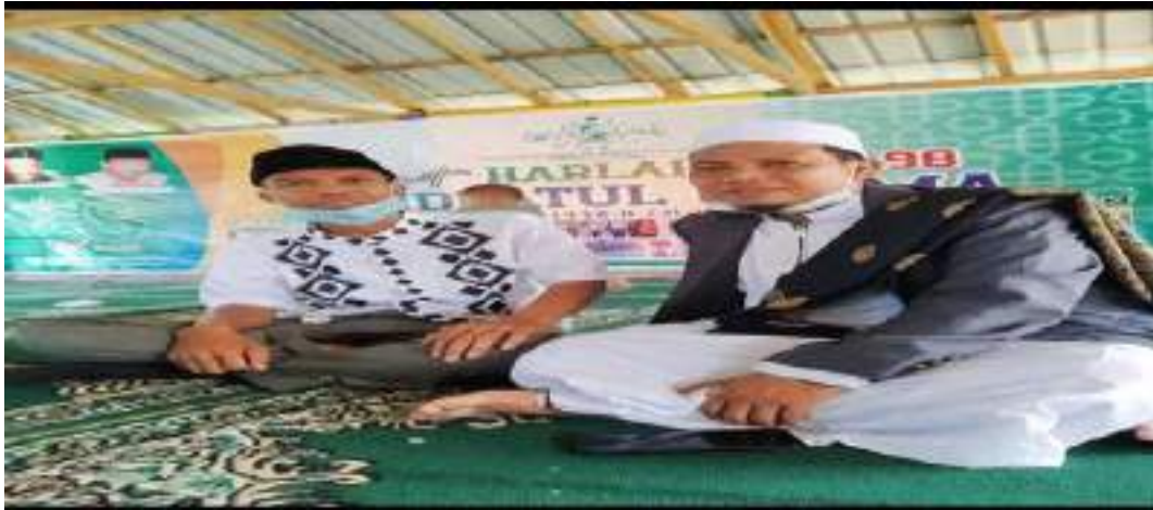
WAWANCARA DENGAN KEPALA KUA KEC. PAJO