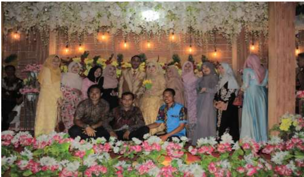
ACARA JAMBUTA TEKARNE'E ( PESTA PERNIKAHAN)