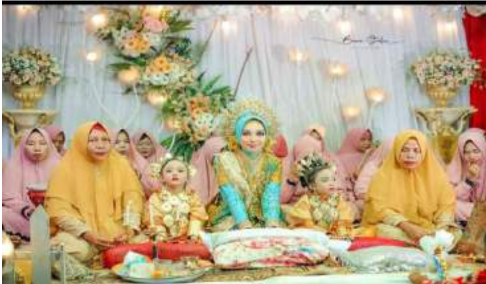
PROSES PERSIAPAN ACARA ZIKI PETA KAPANCA