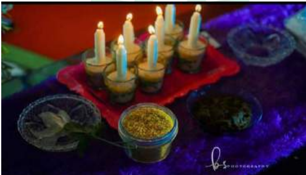
BAHAN-BAHAN UNTUK PROSES ACARA ZIKI PETA KAPANCA