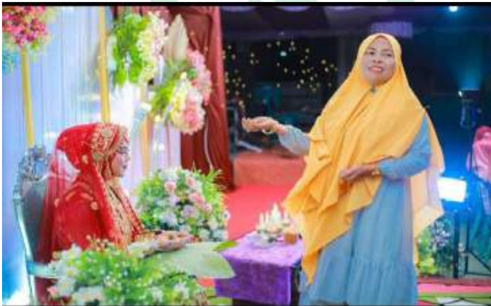
PROSES TABURAN BERAS KUNING PADA ACARA ZIKI PETA KAPANCA