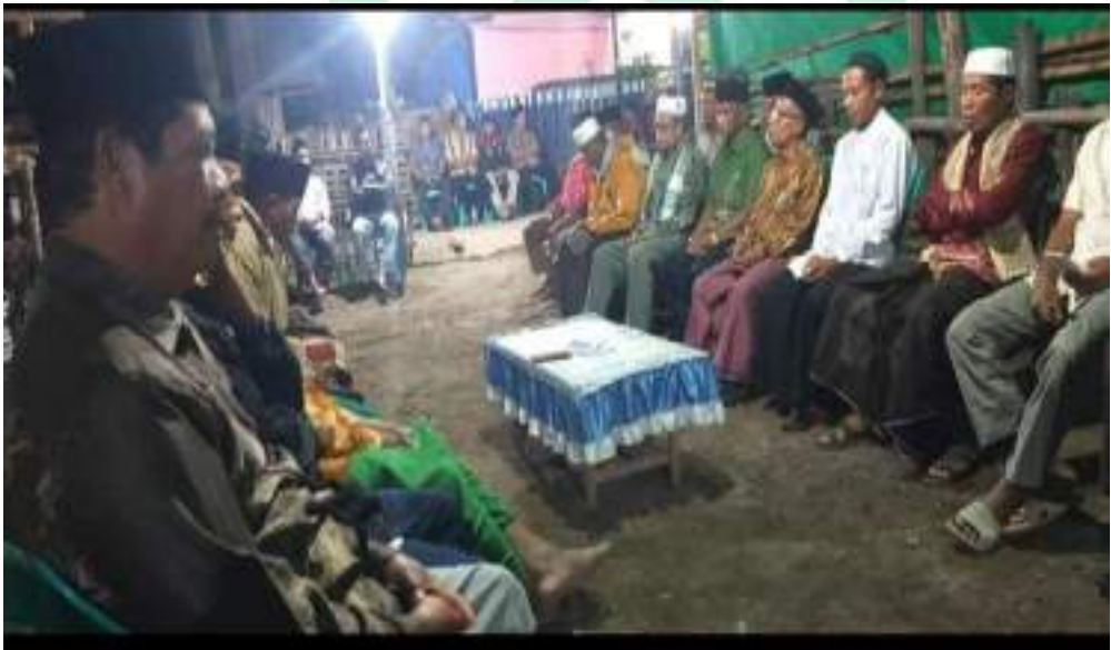
ACARA MBOLO WEKI