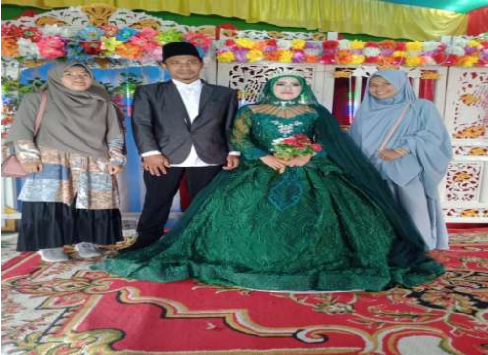
ACARA JAMBUTA TEKARNE`E ( PESTA PERNIKAHAN )