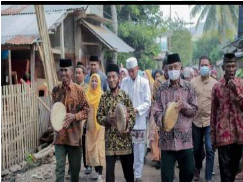
ACARA WA,A CO'I