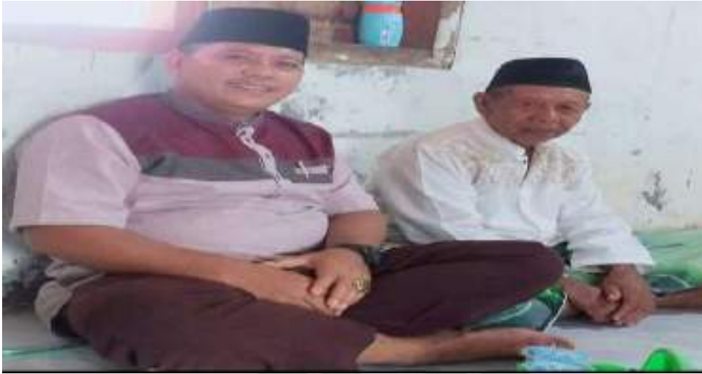
ACARA PANATI ( PRA LAMARAN )