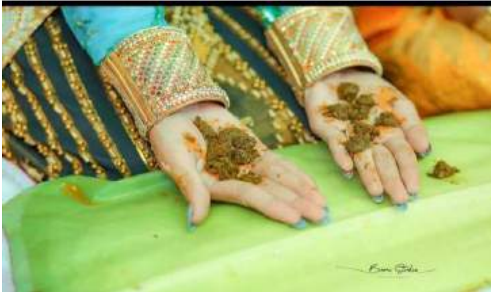
PROSES LUMATAN DAUN INAI DI TANGAN MEMPELAI PEREMPUAN