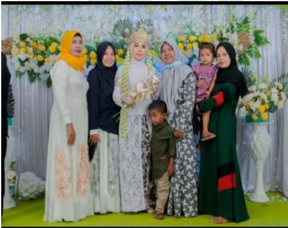
PROSESI Lafa ( AKAD NIKAH )