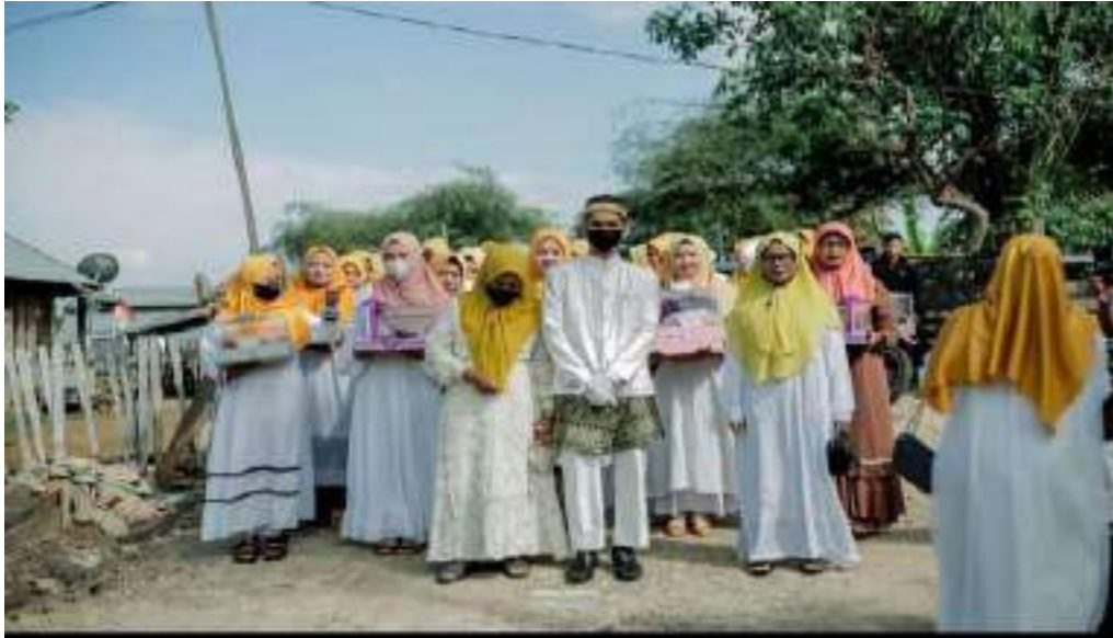
PROSES ACARA WA,A CO'I ( PENGANTARAN MAHAR)