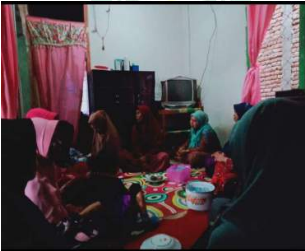
ACARA WI,INGGAHI ( LAMARAN )