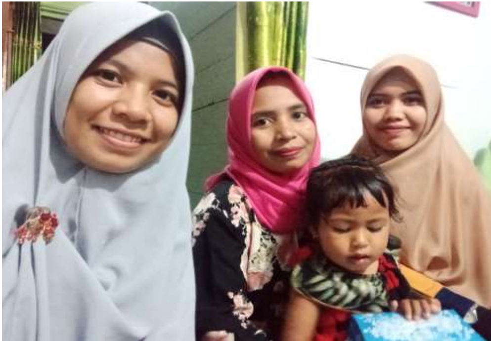
ACARA MBOLO WEKI