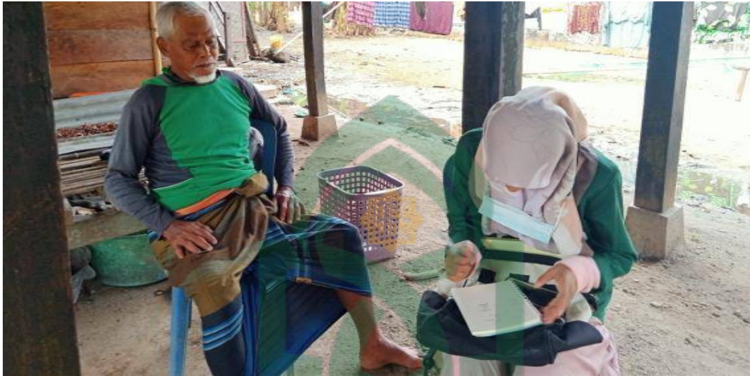
Gambar 1” Dokumentasi Wawancara dengan Warga yang dianggap paham dengan Tradisi yang diteliti”