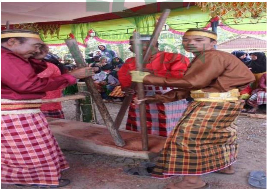
Gambar 3” Inilah yang dinamakan Mappadendang dimana prosesi menumbukkan alu ke sebuah lesung dengan irama atau sebuah nada”