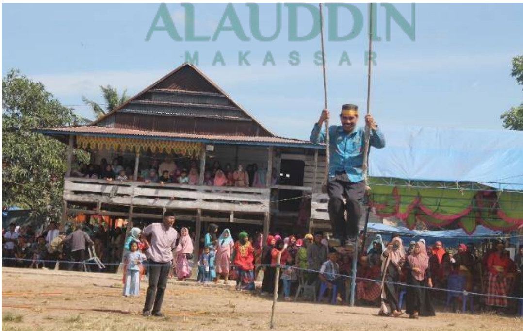
Gambar 2” Maddoa Serangkaian dengan acara Mappadandang. Maddoa merupakan acara hiburan yang dilakukan pada saat dilaksanakannya tradisi Mappadandang”