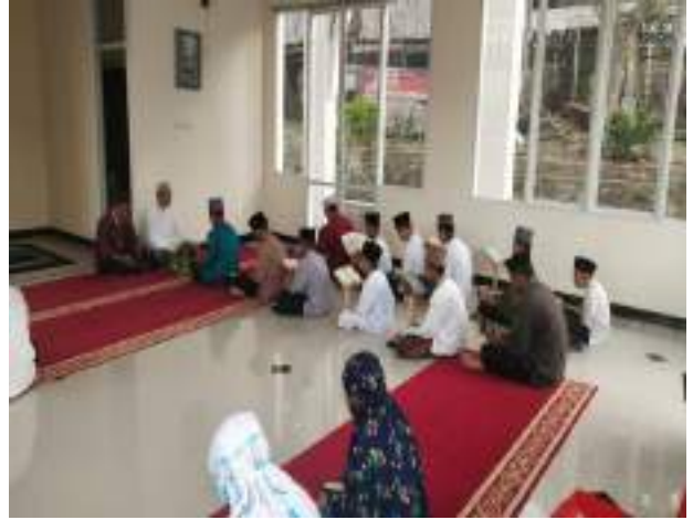
Santri Rumah Tahfizh Tatemmamala Kabupaten Soppeng menghadapkan hafalannya.