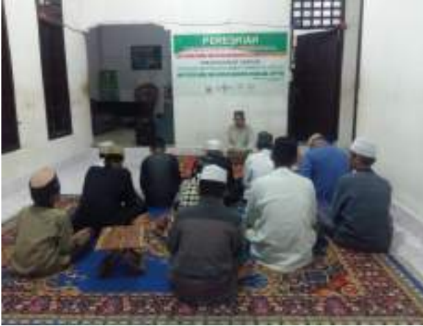
Santri Rumah Tahfizh Tatemmamala Kabupaten Soppeng belajar qira'ah.