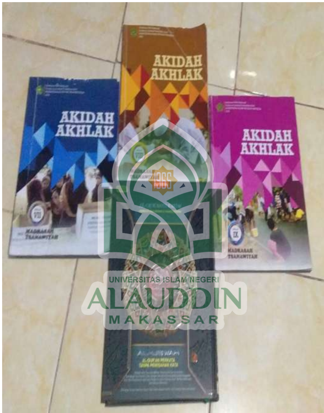
Lampiran 4 : Buku paket pembelajaran Akidah Akhlak dan Kitab Suci Al-quran