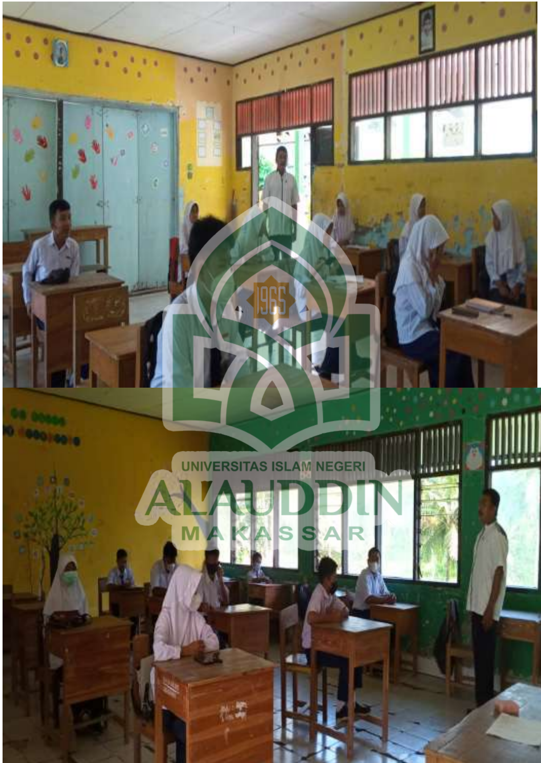
Proses Belajar Mengajar Mata Pelajaran Akidah Akhlak Kelas VIII