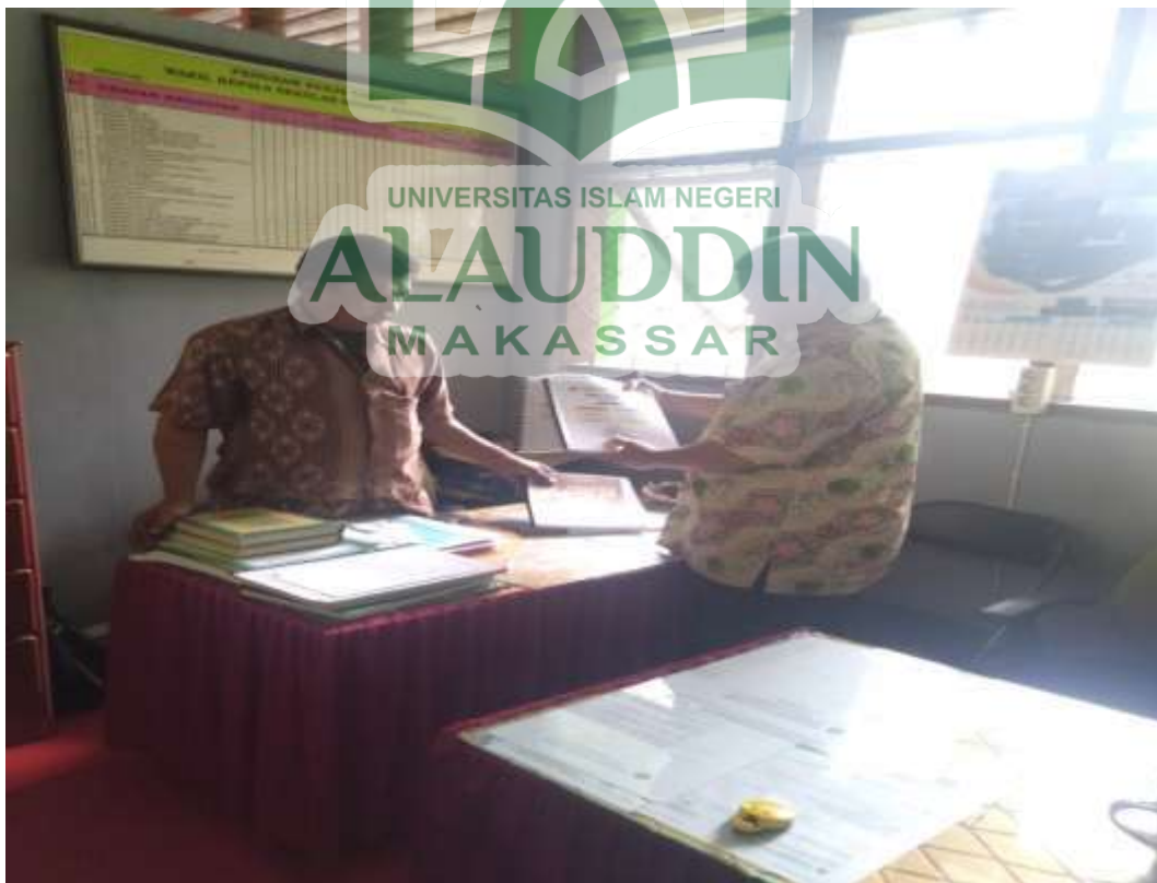
Observasi Perangkat Pembelajaran Akidah Akhlak