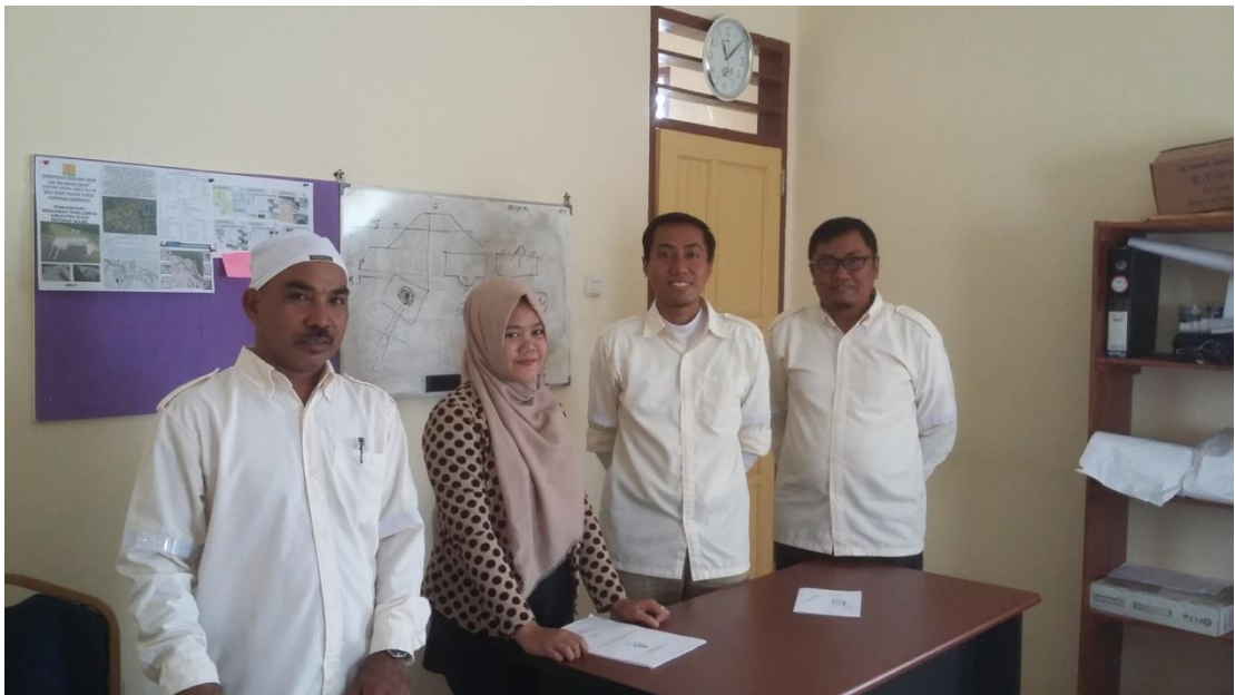
Foto setelah wawancara dengan Karyawan, Di Kantor Pu Bendungan