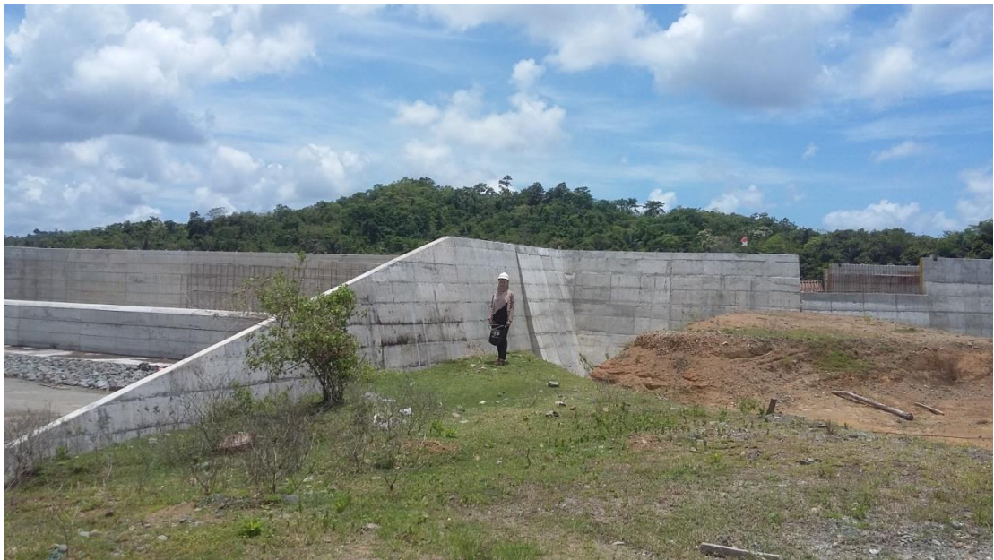
Lokasi Pembangunan Bendungan Paselloreng