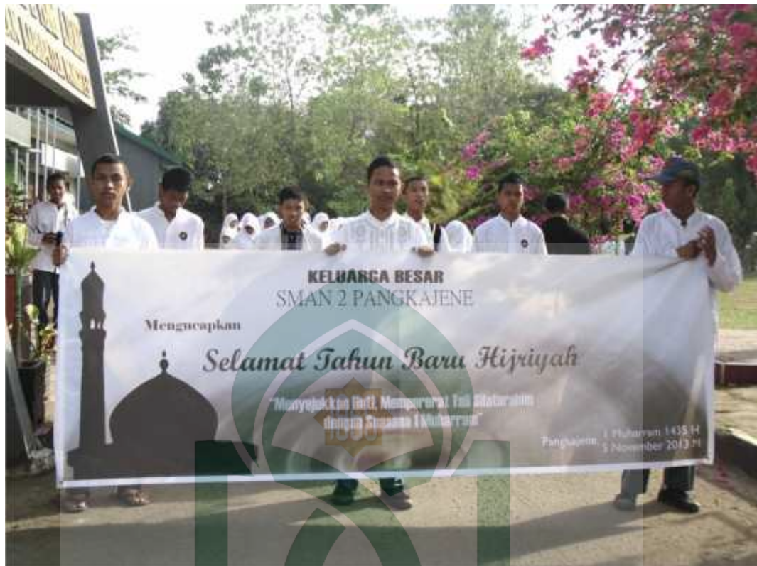
Kegiatan Hari-Hari Besar Islam

UNIVERSITAS ISLAM NEGERI ALAUDDIN M A K A S S A R