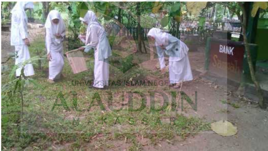
Akhlak Terhadap Lingkungan