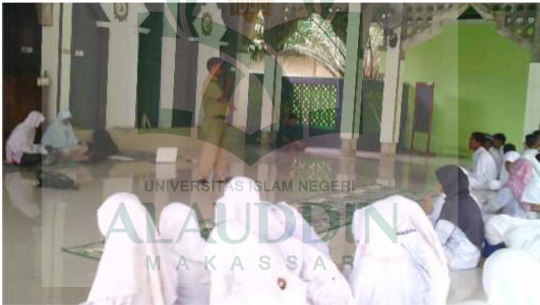
Pengajian rutin di Mesjid SMA Negeri 2 Pangkajene