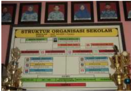
gambar 9: struktur organisasi SMPN 1Parigi