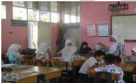
Gambar 5 : doc. diskusi kelompok