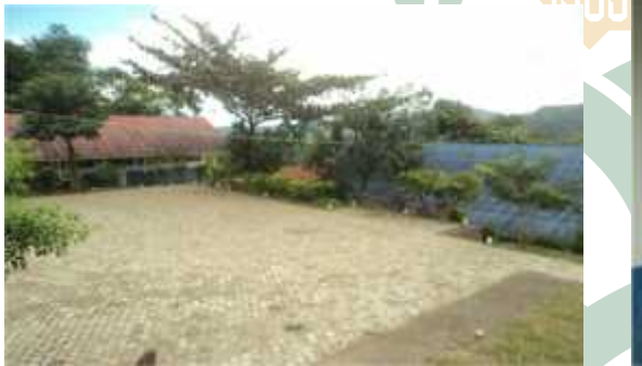
gambar 11: lapangan SMPN 1Parigi