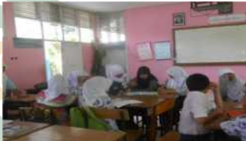
Gambar 4 : dokumentasi diskusi kelompok