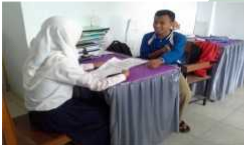
gambar 3 : wawancara peserta didik