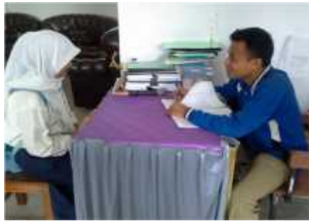
Gambar 1 : wawancara peserta didik