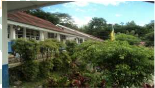
gambar 12 : kelas SMPN 1 Parigi