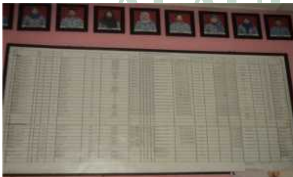
Gambar 13 : papan nama guru dan tenaga kependidikan