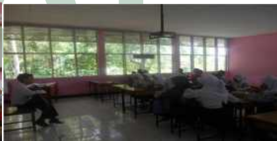
Gambar 6 : dokumentasi diskusi kelompok