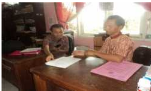
Gambar 8 : wawancara guru PAI SMPN 1