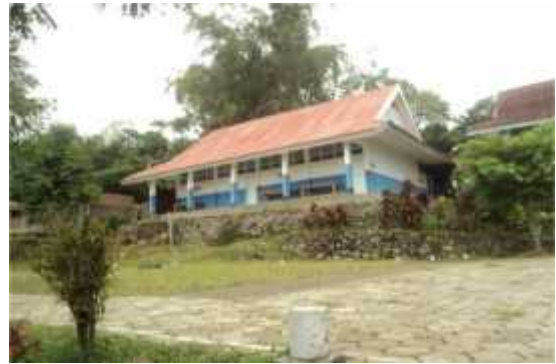
gambar 10: kelas SMPN 1Parigi