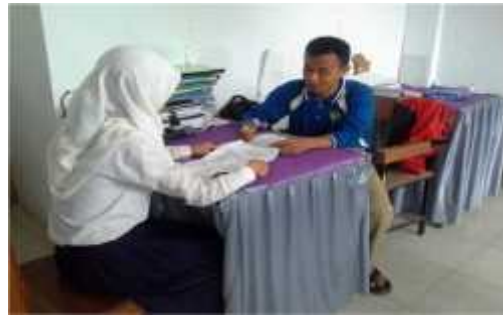
Gambar 2 : wawancara peserta didik