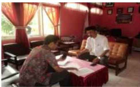
Gambar 7 :wawancara Kepala SMPN 1 Parigi.