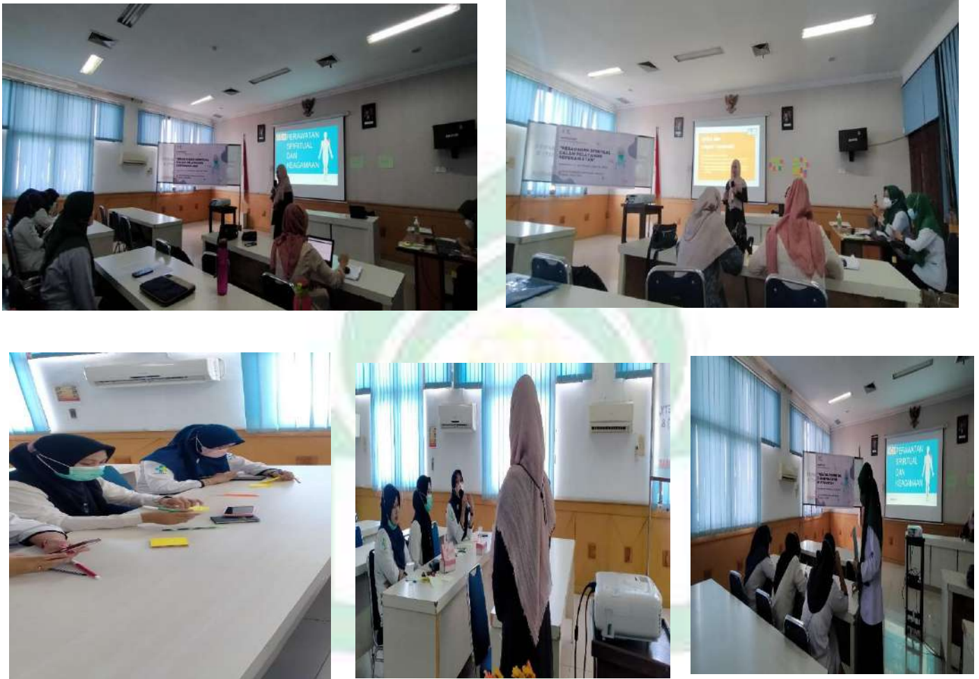
Gambar 1. Prosesi workshop