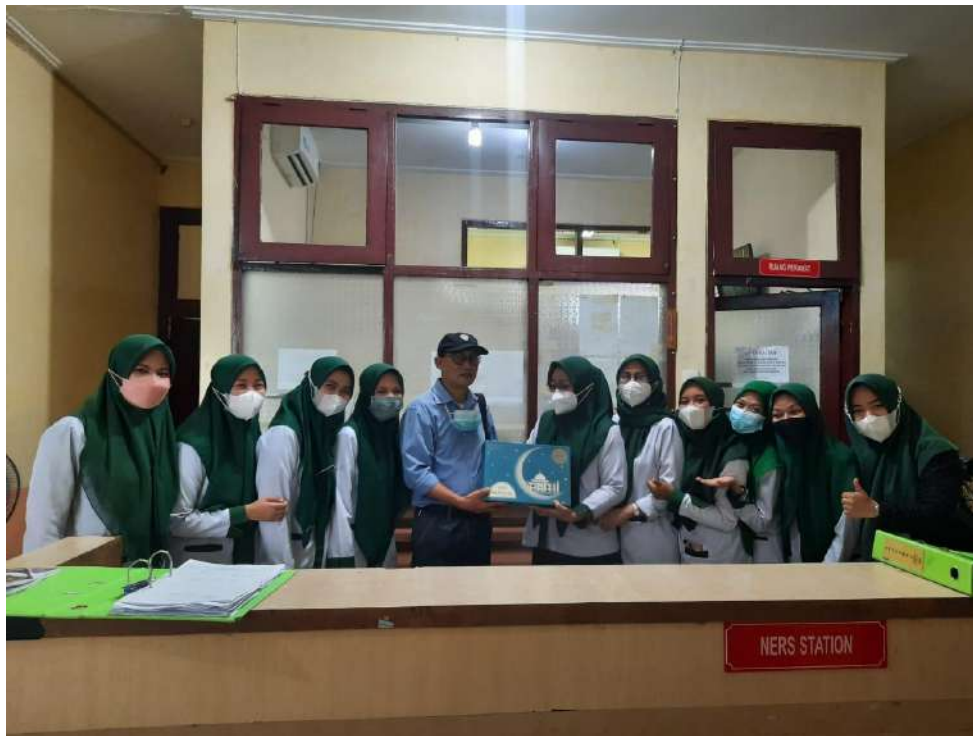
Gambar 5. Penyerahan Spiritual KIT Kepada Kepala Pelayanan Lontara 5