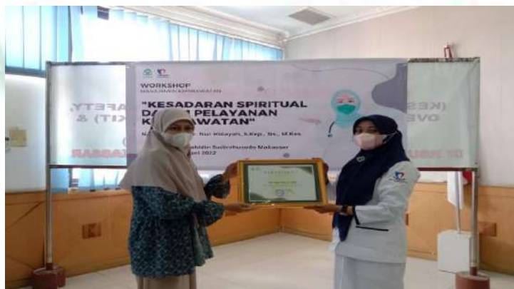
Gambar 2. Penyerahan Piagam Sertifikat Kepada Kepala Ruang Lontara 5