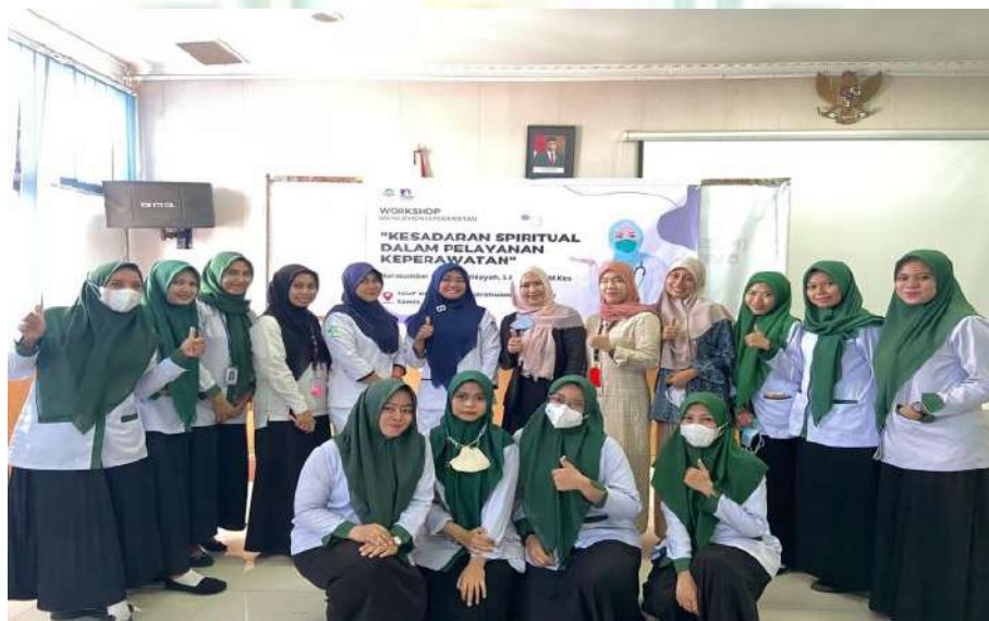
Gambar 4. Sesi Foto Bersama dalam Workshop Kesadaran Spiritual dalam Pelayanan Keperawatan