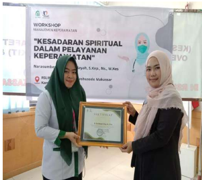
Gambar 3. Penyerahan Piagam Sertifikat Kepada Narasumber