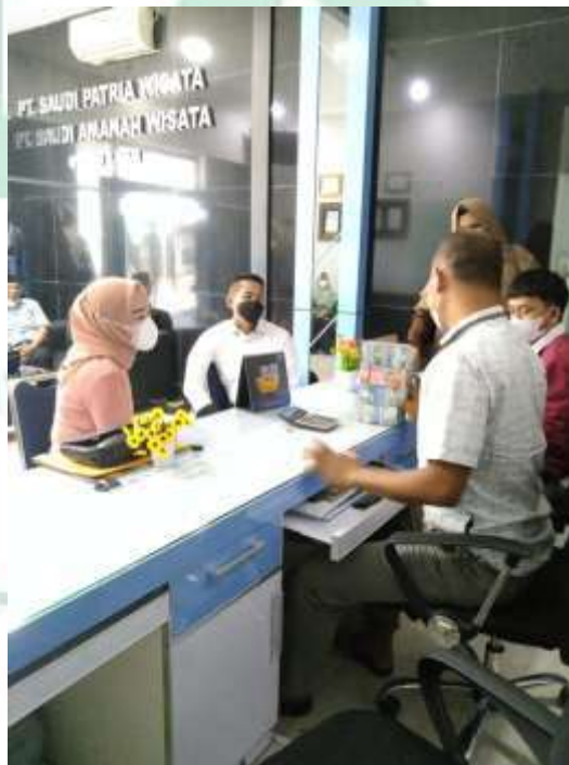
Kondisi Kantor PT. Saudi Amanah Wisata Makassar