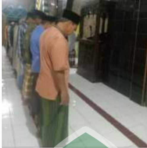
(Suasana shalat berjamaah di Masjid Hidayatullah)