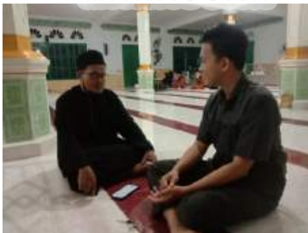
(Wawancara bersama Pak Camat, Pak Desa, dan Tokoh Agama)