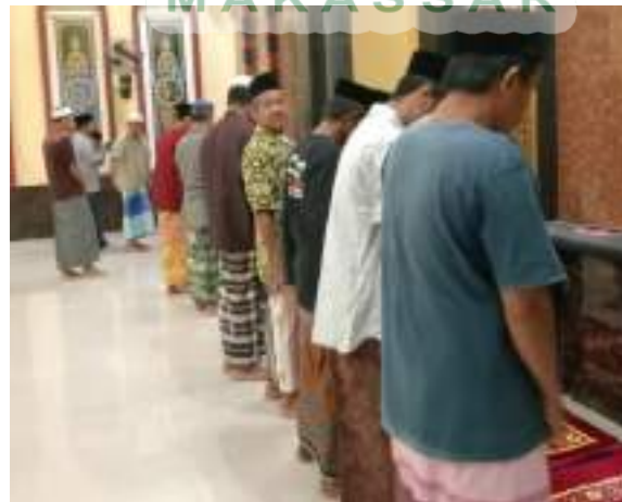
(Suasana shalat berjamaah di Masjid Al Kautsar)