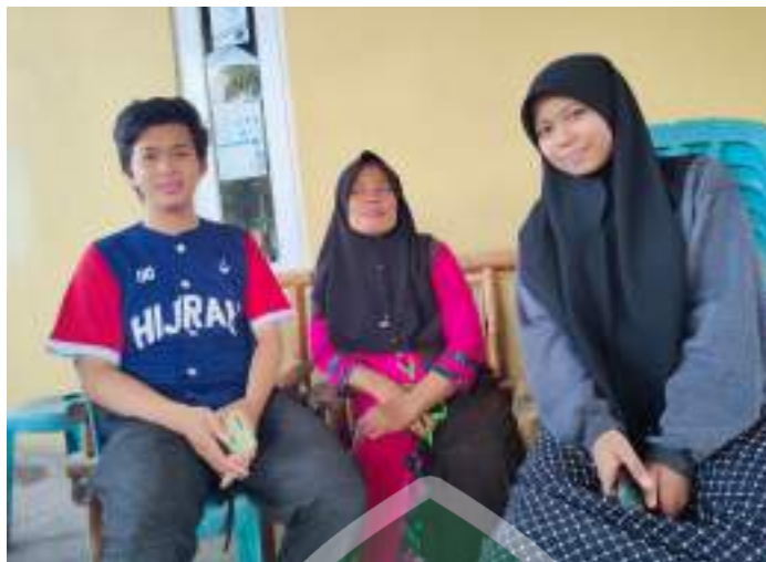
(Wawancara bersama Ibu Hj. Sia dan anaknya)