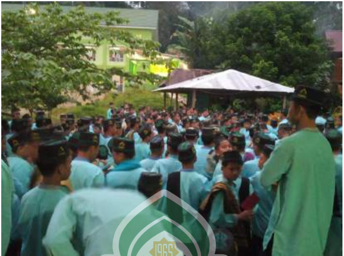
c. Ziarah Kubur