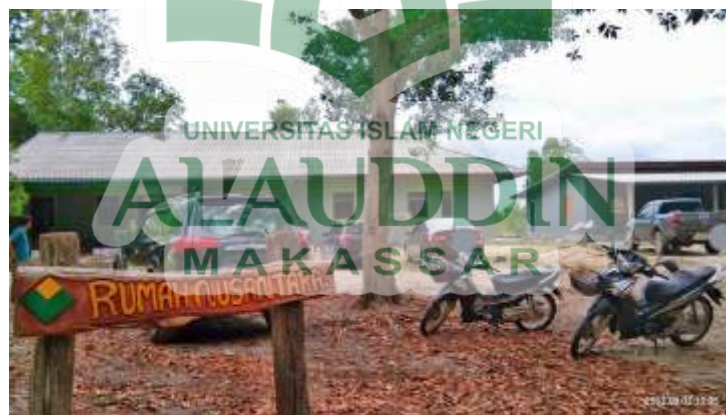
Gambar 4 Rumah Nusantara di Baloi

Program ini, keungannya ditanggungjawab penuh oleh Mulnithi Nusantara.