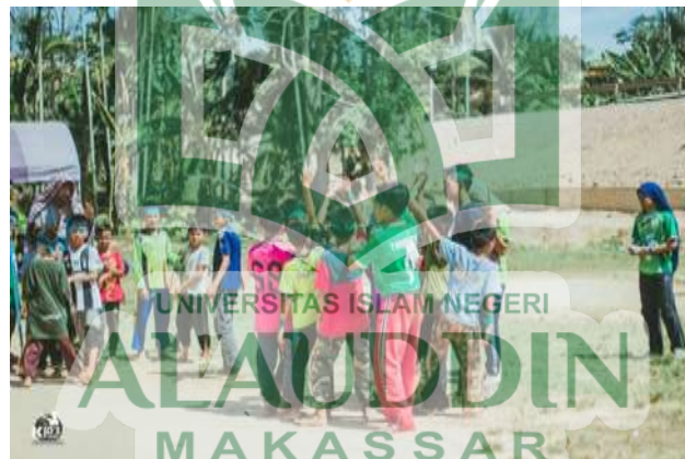
Gambar 3 Program Kid's camp ( Kursus Musim Panas Anak tayim)

Selain itu, tujuan dari projek ini adalah untuk membina generasi pemuda (junior) yang bertanggungjawab terhadap masyarakat, membina potensi pemuda dan pemudi untuk berkhidmat kepada masyarakat, dan melahirkan sifat bertanggungjawab terhadap masyarakat, menjadi harapan bangsa di masa depan nanti 147