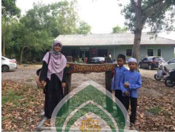
Gambar bersama Anak Yatim di Rumah Nusantara di Baloi