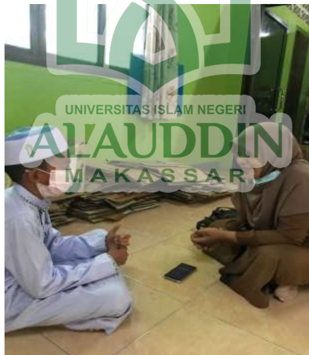
Wawancara Anak Yatim Nusantara