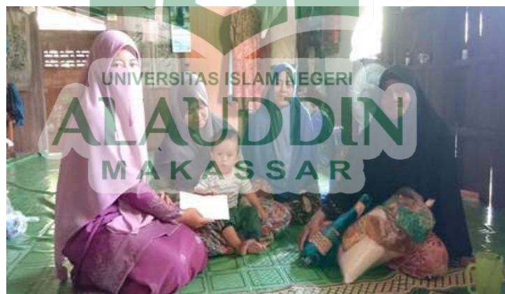
Gambar 2 Program Menziarahi Anak Yatim

Projek ini merupakan projek asas yang harus dilakukan dalam lembaga Mulnithi Nusantara ini. Pada awal terbentuk Lembaga ini bertujuan untuk bersilaturrehmi dan memberi bantuan terhadap mereka. Menurut persepakatan staff- staff Mulnithi Nusantara, mereka akan menziarahi keluarga musibah setiap bulan 5 keluarga, adapun jika terada case insrtuksi mereka segera mengunjungi keluarga tersebut untuk menjalin salaturrahim dan memulih jiwa-jiwa anak-anak yatim. Setiap kali menziarahi keluarga musibah mereka akan menyedia makanan asasi yaitu: Beras, menyak, gula dan lain-lain dalam lingkup uang 1000 bath. Manakala uang yang digunakan dalam projek ini adalah uang dermawan dan Peti khairat dari masyarakat tempatan.