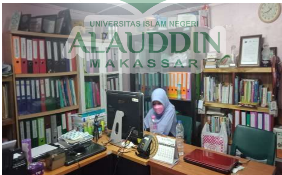
Kantor Mulnithi Nusantara Provinsi Yala