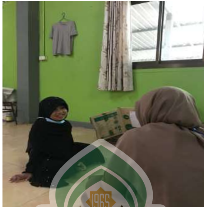
Wawancara anak Yatim Mulnithi Nusantara