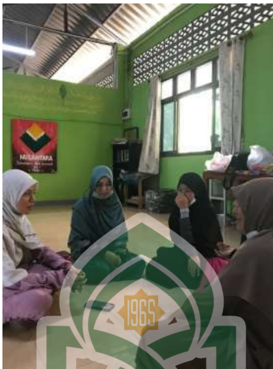
Wawancara Staff Petugas Mulnithi Nusantara