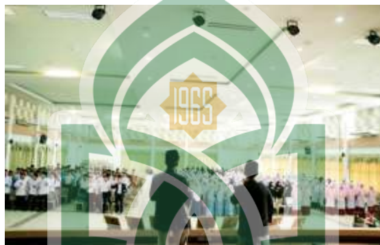
Gambar 11 Seminar Pemuda-Pemudi