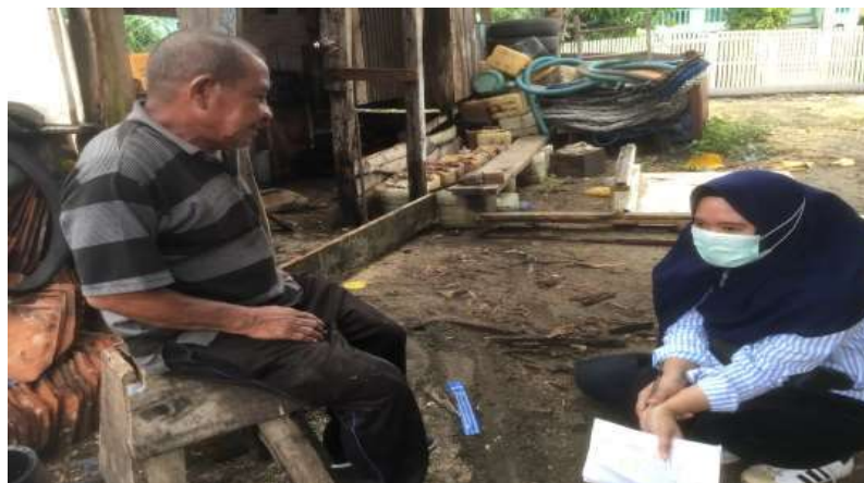
Gambar 10: Wawancara bersama masyarakat