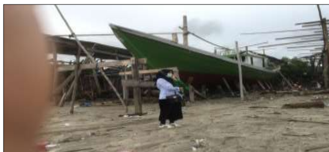
Gambar 13: Perahu yang akan di dorong kelaut/ Annyorong Lopi