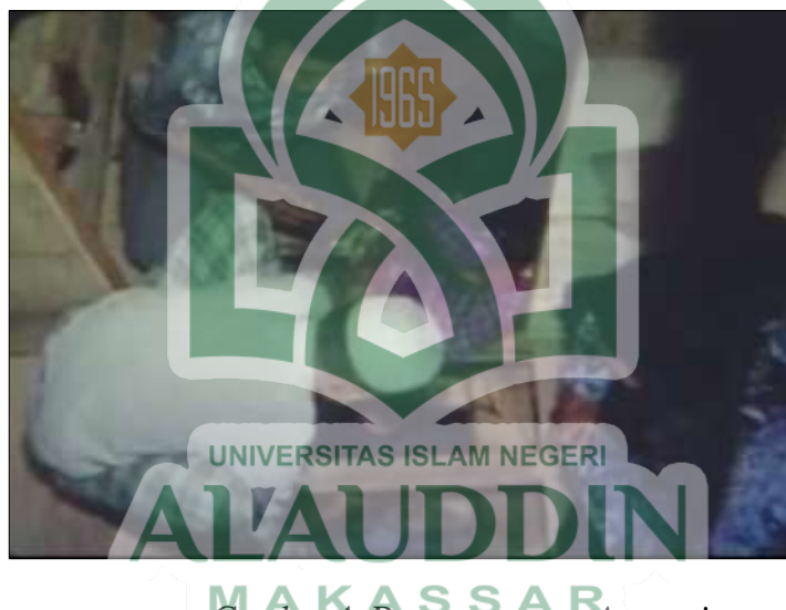
Gambar 4: Proses upacara Ammosi

Upacara ini adalah pemberian pusar pada pertengahan lunas perahu yang selanjutnya akan dilakukan penarikan perahu ke laut. Pada upacara ritual ini telah dilakukan punggawa sejak leluhur mereka.