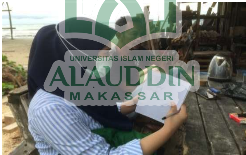
Gambar 2: Wawancara bersama pemilik mesin kayu