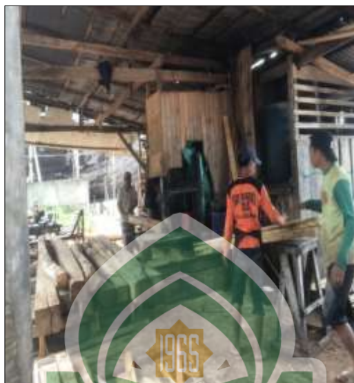
Gambar 1: Proses pengolahan kayu dijadikan balok dan papan

Kalabiseng (Lunas perahu) adalah merupakan komponen dasar dan utama sebuah perahu, sebab pada komponen ini akan dilekatkan kepingan-kepingan papan sampai terbentuk sebuah perahu. Oleh sebab itu kayu untuk bahan lunas harus dipilih dari jenis kayu tertentu yang memenuhi persyaratan baik ukuran maupun kualitasnya. Di samping itu ada beberapa pantangan dalam memilih kayu lunas, seperti misalnya tidak boleh menggunakan kayu bekas, atau kayu dari pohon yang tumbang sendiri kayu yang hanyut, ataupun kayu yang cacat. Berdasarkan hal tersebut diatas, apabila Punggawa meninjau hutan yang memiliki jenis kayu yang akan diolah menjadi bahan baku, maka yang pertama dicari ialah pohon yang akan dijadikan Kalabiseng .