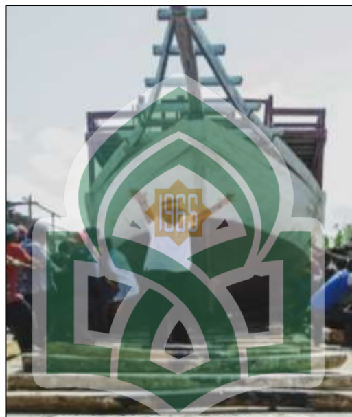
Gambar 1 Proses Annyorong Lopi

berada disekitar lokasi kemudian begotong royong menarik perahu menuju lautan, semua tokoh agama, tokoh masyarakat dan tokoh besar dalam pembuatan perahu pinisi hadir.