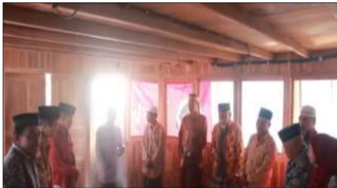
Gambar 3: proses upacara Appasili

Appasili adalah upacara ritual yang dilakukan pada malam hari sebelum Ammosi , dan bertujuan untuk menolak bala. Upacara ini dilakukan bersamaan dengan upacara Ammosi , upacara ini mengandung unsur Islam diantaranya dengan pembacaan barazanji dan sebagainya. Sebelum upacara dilaksanakan, terlebih dahulu disiapkan kelengkapan antara lain satu cerek air yang diambil dari mata air tertentu.