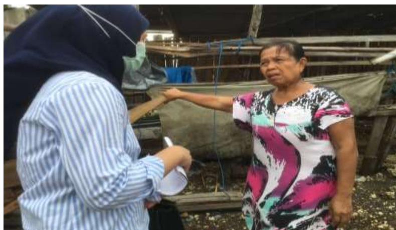
Gambar 7: Wawancara bersama masyarakat