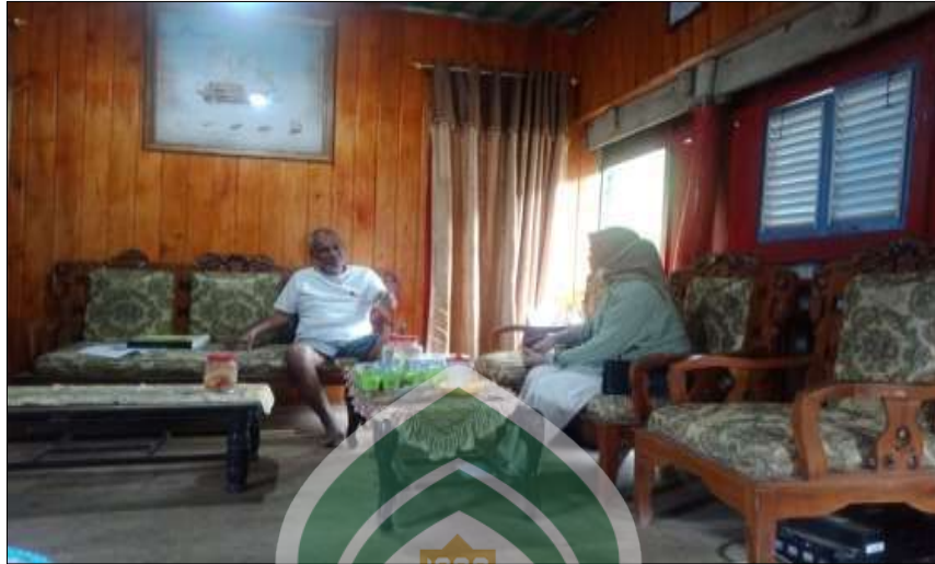
Gambar 1: Wawancara bersama ahli budayawan Desa Ara