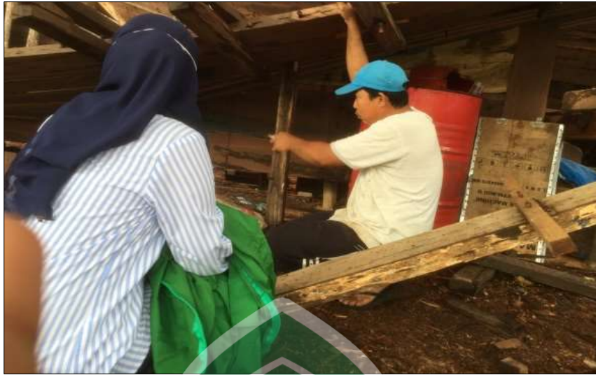
Gambar 3: Wawancara bersama punggawa perahu