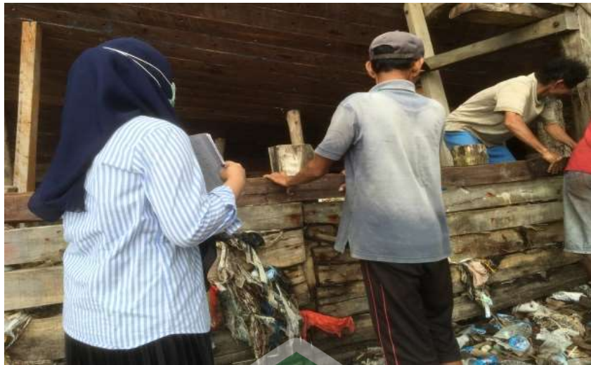
Gambar 5: Wawancara bersama sawi