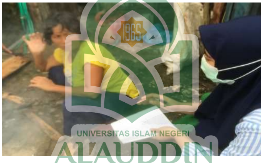
Gambar 6: Wawancara bersama masyarakat