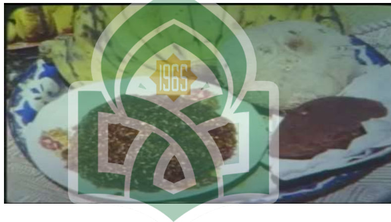
Gambar 12: Sesajen yang disiapkan pada saat upacara penyambungan Lunas