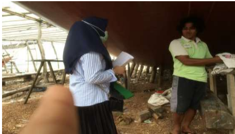
Gambar 8: Wawancara bersama punggawa