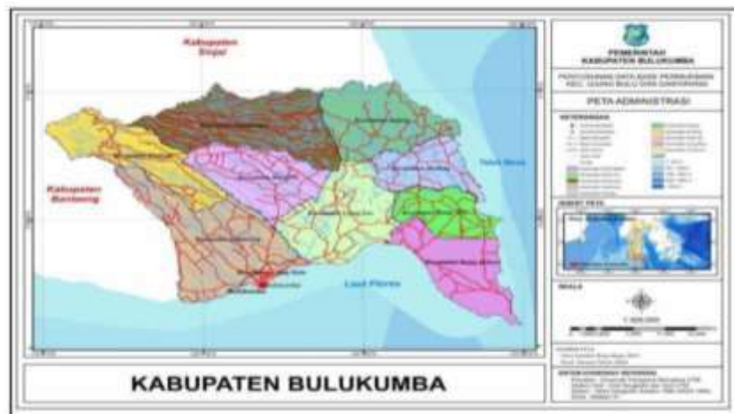
Gambar 1 Peta Kabupaten Bulukumba