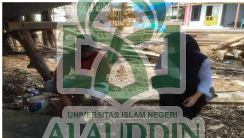
Gambar 9: wawancara bersama sawi