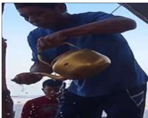
Gambar 2: Proses Upacara Penyambung Lunas/ Balok