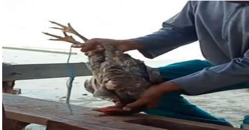
Gambar 11: Upacara penyambungan lunas yaitu mengoleskan darah pada lunas