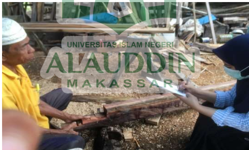
Gambar 4: Wawancara bersama punggawa sekaligus toko adat