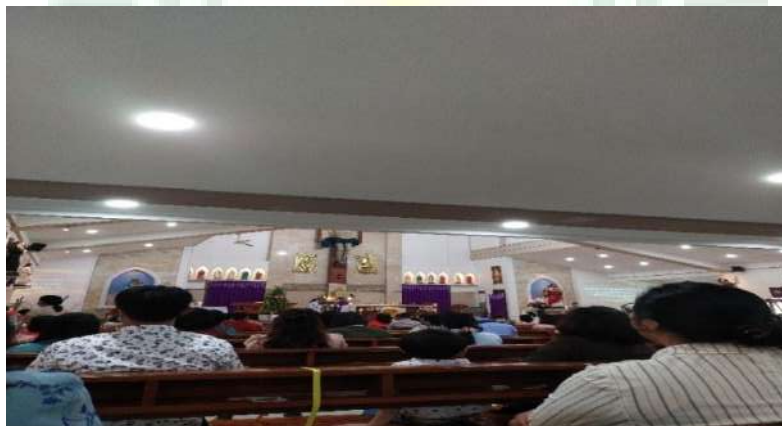
Gambar 7. Suasana Ibadah Minggu Advent IV