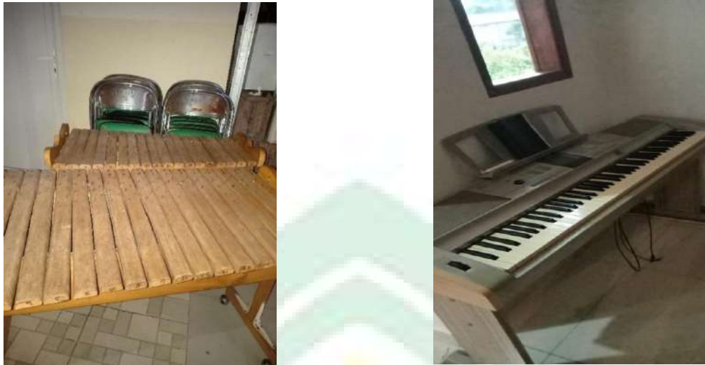
Gambar 6. Alat Musik Kolintang (Kiri) Alat Musik Piano (Kanan)