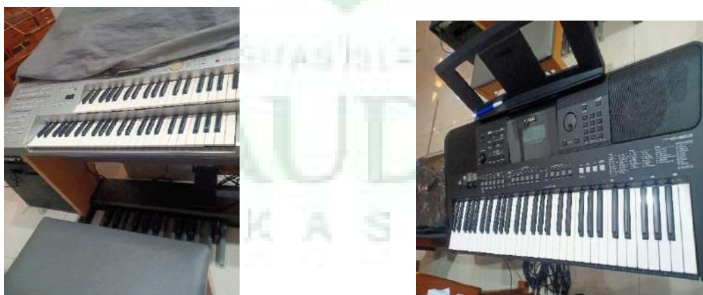
Gambar 5. Alat Musik Organ Pipa (Sebelah Kiri), Alat musik Keyboard (Kanan)