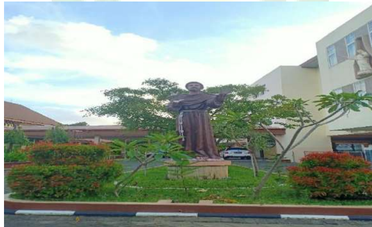
Gambar 2. Patung Santo Fransiskus Assisi