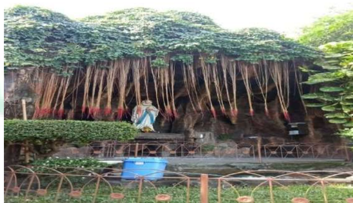
Gambar 3. Gua Bunda Maria