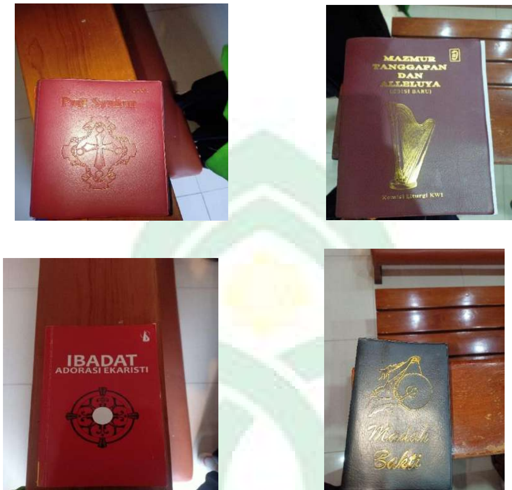
Gambar 4. Buku Nyanyian Gereja Santo Fransiskus Assisi Makassar