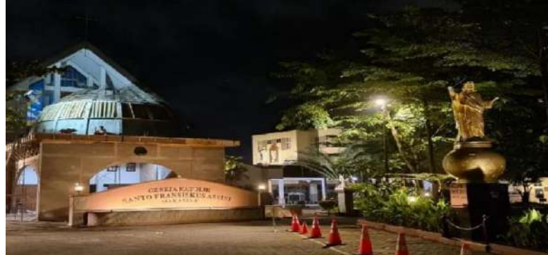
Gambar 1. Halaman depan Gereja Katolik